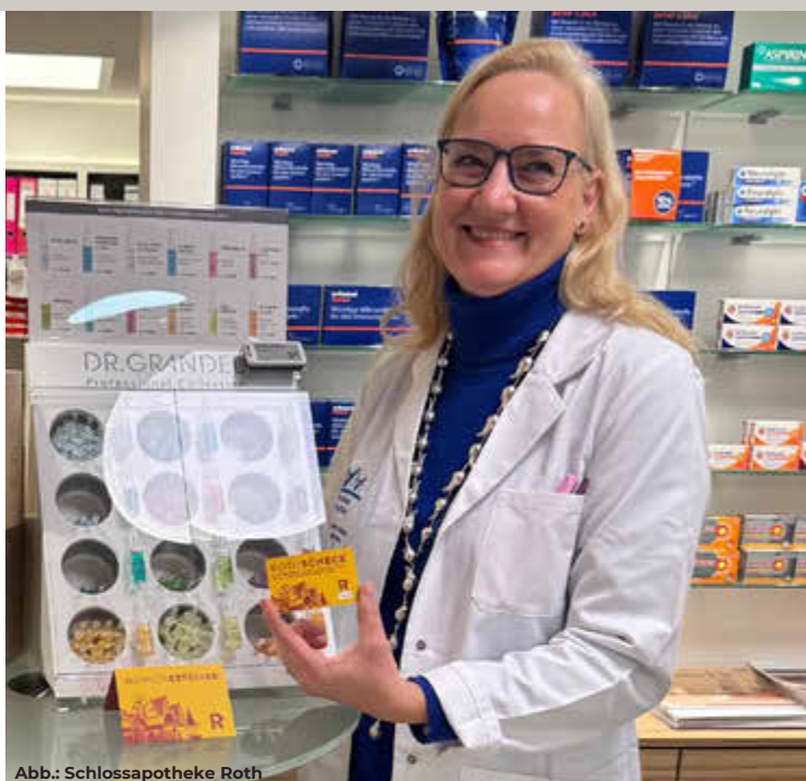
Abb.: Schlossapotheke Roth

Aral, Chiceria, EDEKA Fischer, Fiedler Optik, Genniges Bücher, Restaurant Gartenlaube, Schloss Apotheke, Toy Partner, TUI ReiseCenter, Uhren Schmuck Braun