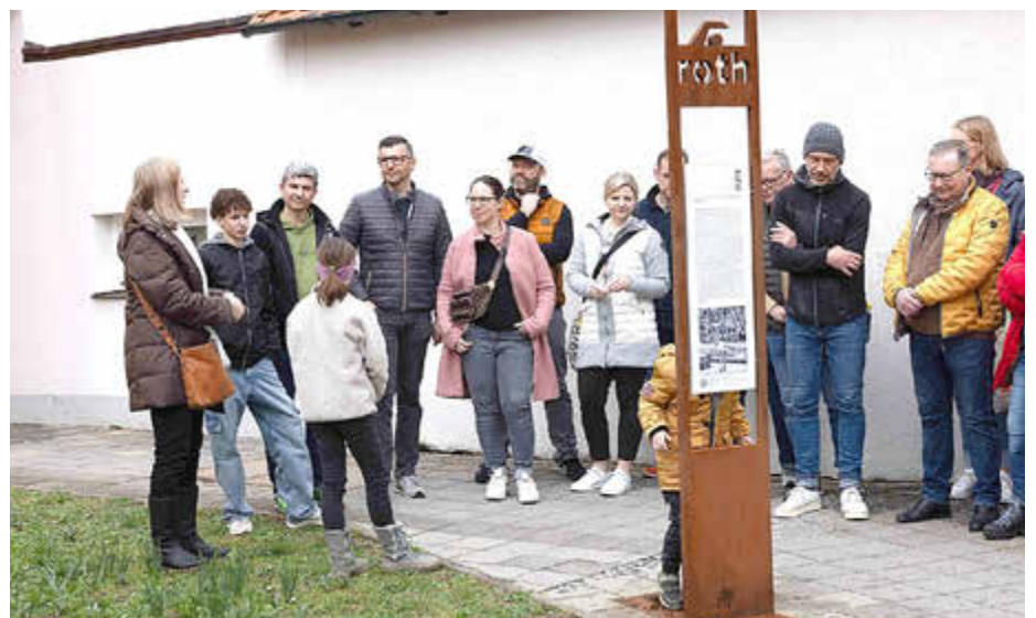
Eine Führung entlang des Walk of Triathlons steht am Sonntag, 21. Juni auf dem Programm.