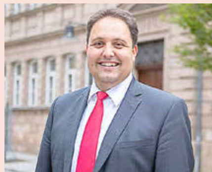
Der Erste Bürgermeister Andreas Buckreus freut sich auf die Fragen der Rother Bürger*innen.

Vorzimmer des Ersten Bürgermeisters Tel. 09171 848-102 E-Mail: vorzimmer@stadt-roth.de