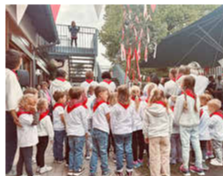
Im traditionellen Kärwa-Gewand feierten die Kindergartenkinder ihr diesjähriges Sommerfest

Die Kinder begeisterten mit Liedern und Tänzen rund um einen liebevoll geschmückten Kärwabaum. Für Unterhaltung sorgten Popcornstand, Losbude, Kinderkarussell, Dosenwerfen und Wasserspritzen. Bei bestem Wetter genossen Besucher*innen Weißwürste, Wienerle und ein reichhaltiges Kuchenbuffet. Das Sommerfest bot einen gelungenen Vormittag für Groß und Klein und stimmte die Eckersmühlener Bevölkerung bestens auf die bevorstehende Kärwa ein, die eine Woche später stattfand.