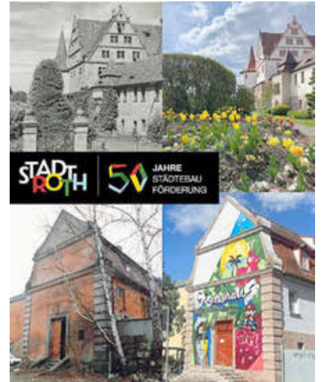
Die digitale Stadtrallye führt zu einigen Orten in Roth, die in den letzten fünfzig Jahren von der Städtebauförderung profitiert haben.

Weitere Informationen sowie der QR-Code zur Teilnahme sind auf der städtischen Website unter www.stadt-roth.de/stadtrallye zu finden.