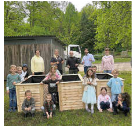
Kinder der Kita mit ihren Erzieherinnen und Mitarbeitern der Firma Humpenöder freuen sich über die drei neuen Hochbeete.