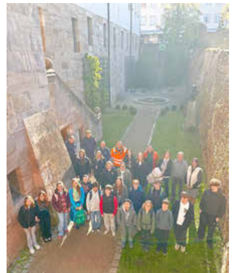
22 Jugendliche nahmen am diesjährigen Girls' and Boys' Day teil.