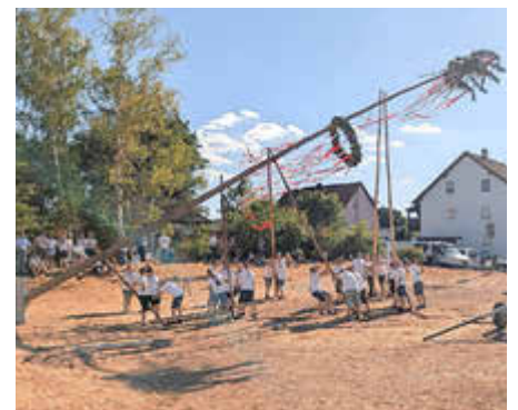
Das Kirchweihbaumaufstellen gehört zur Tradition der Pfaffenhofener Kirchweih.