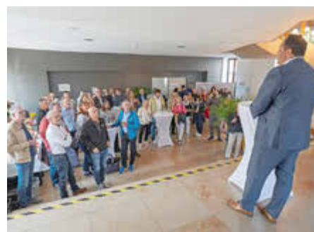
Zahlreiche Gäste kamen am „Tag der Städtebauförderung“ zusammen um „50 Tage Städtebauförderung in Roth“ zu würdigen.

Ergänzend wurden eine Jubiläums- broschüre sowie eine Outdoor-Aus- stellung im Stadtgebiet gestaltet, die zentrale Projekte der vergangenen 50 Jahre sichtbar machen und die Entwicklung der Stadt anschaulich dokumentieren.