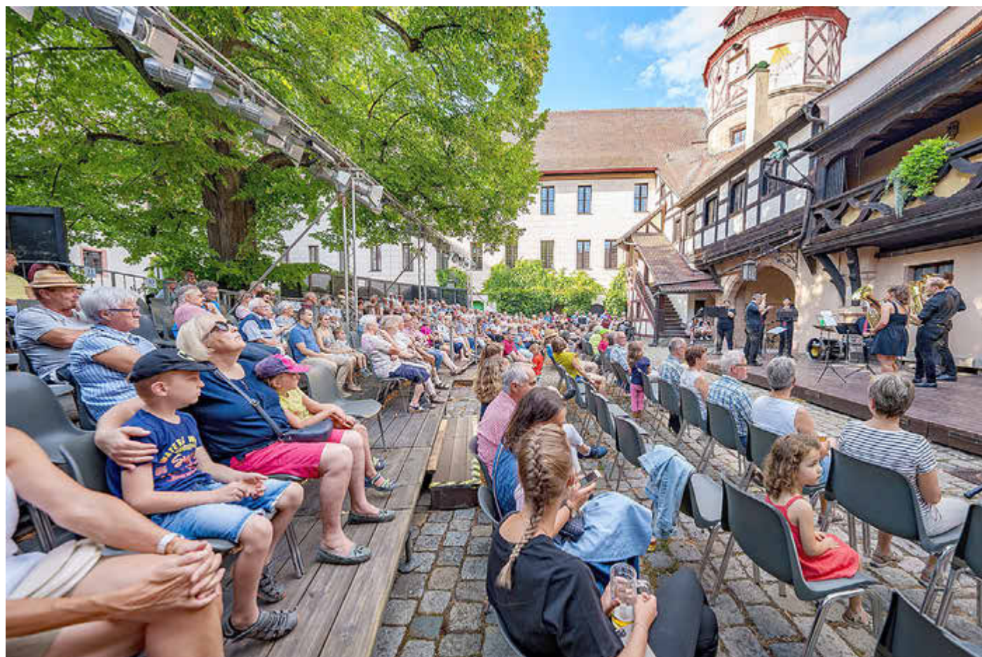
Das Rother Stadtorchester spielt auch beim Schlosshof Open Air.

Alle weiteren Details zu dieser Veranstaltungsreihe – auch zu den jeweiligen Regenalternativen – stehen online unter https://www.stadt-roth.de/soa .