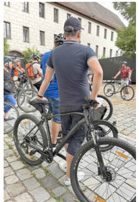
Auch 2026 dürfen sich die Teilnehmenden des Stadtradelns auf eine Eröffnungstour freuen, wie hier im Jahr 2024.

Mitmachen lohnt sich – für die Umwelt, für die eigene Fitness und für ein starkes Gemeinschaftsgefühl in der Stadt. Roth freut sich auf viele engagierte Radler*innen, die auch in diesem Jahr wieder zeigen, wie klimafreundliche Mobilität aussehen kann.