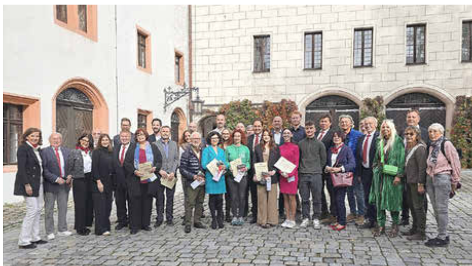
Im Herbst 2026 sollen die Bürgerehrungen (wie hier im Bild von 2025) erneut stattfinden - Vorschläge können ab sofort eingereicht werden.

Die Stadtverwaltung freut sich auf viele Vorschläge samt detaillierter Informationen über die Leistungen und Erfolge der Rother*innen!