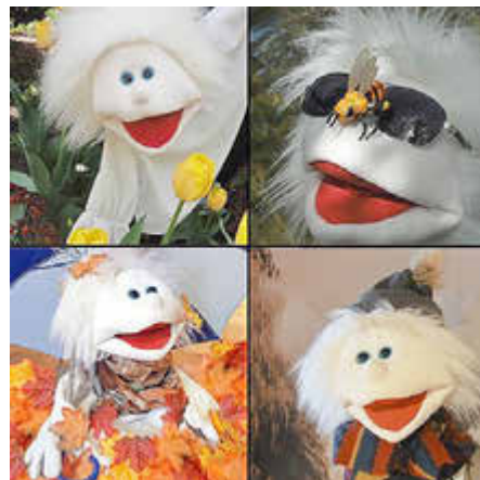
Johann und die Jahreszeiten

Schloss. An Stationen für alle Sinne gilt es außerdem, die Jahreszeiten einmal anders zu entdecken: Hörst