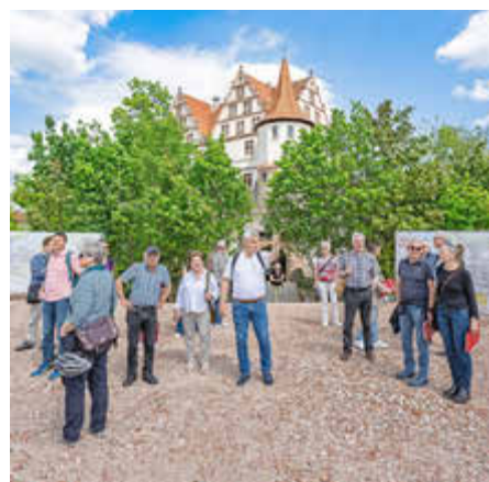
Ein besonderer Anblick bot sich den Teil- nehmenden der Führung, die erstmalig auch auf Rother Neuland führte.