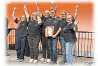
Das zweite Bild zeigt das Klappstuhl-Team/ Bild

Als wertvoll und impulsgebend wahrgenommen zu werden und mit unserer mobilen Kulturbühne etwas ganz Besonderes zu schaffen, macht uns sehr stolz.