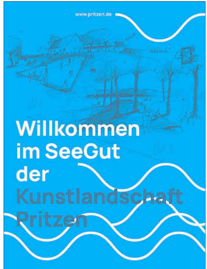
Visualisierung: SeeGut Pritzen @Kunstlandschaft Pritzen e.V.

Das SeeGut mit Kunstscheune, Saal und Seestube kann für private Feiern und Events genutzt werden. Nutzungsanfragen unter: SeeGut@kunstlandschaft.pritzen.de