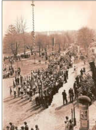
Archiv: Horst Bernstein, Maidemo

1982 führte ein Sternmarsch zum Vorplatz der Polytechnischen Oberschule. Bis 1989 wurde der Feiertag mit organisierten Umzügen begangen. Ein ungewöhnlicher Vorfall ereignete sich im Jahr 1998: In der Nacht vom 30. April auf den 1. Mai wurde der Maibaum abgesägt. Unbekannte brachten den Kranz nach Neudöbern und legten ihn dort am Maibaum nieder – ein Ereignis, das vielen bis heute in Erinnerung geblieben ist. Aufgrund von Bauarbeiten musste die Maibaumaufstellung in den Jahren 2002 bis 2005 auf das Gelände der Feuerwehr verlegt werden. Seit 2006 steht der Maibaum jedoch wieder auf dem Marktplatz.