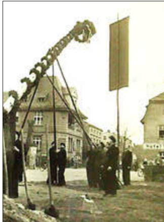
Maibaumaufstellen 30.04.1956

Weinberg zu einer Kundgebung mit anschließendem Maifest. In den folgenden Jahrzehnten blieb der 1. Mai ein bedeutender Bestandteil des öffentlichen Lebens. 1951 wurde der Maibaum wieder auf dem Markt errichtet, während die Feierlichkeiten auf dem damaligen Sportplatz im Park stattfanden.