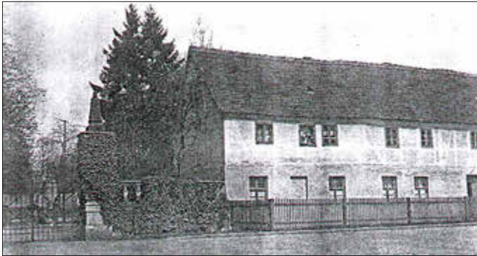
alte Post

Altdöbern blickt auf eine lange und bewegte Geschichte rund um den 1. Mai zurück. Über mehr als zwei Jahrhunderte hinweg spiegeln sich in diesem Datum sowohl gesellschaftliche Entwicklungen als auch lokale Traditionen wider