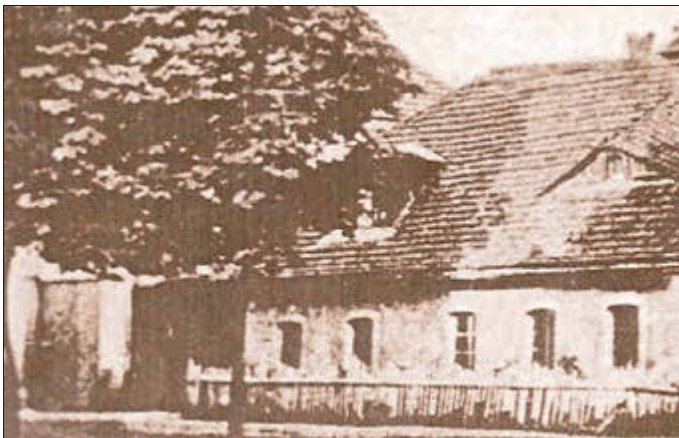
Archiv: Horst Bernstein, alte Schule

Bereits im Jahr 1782 spielte der Ort eine wichtige Rolle im regionalen Verkehrsnetz. Am Markt Nr. 6/7 befand sich eine kursächsische Poststation, die Altdöbern mit der umliegenden Region verband. Mit dem wachsenden Gemeinwesen nahm auch die Bedeutung der Bildung zu: 1836 wurde am Markt der Grundstein für das zweite Schulhaus gelegt.