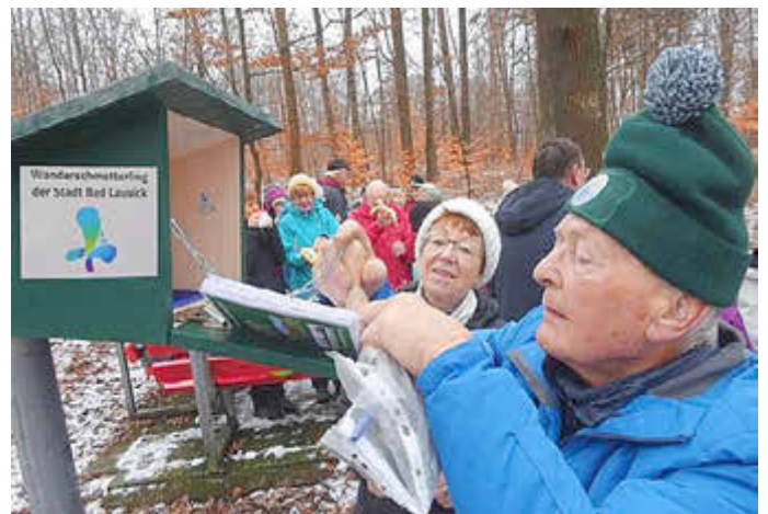
Ein gesponserter Stempelkasten am Waldfrieden wurde rege genutzt