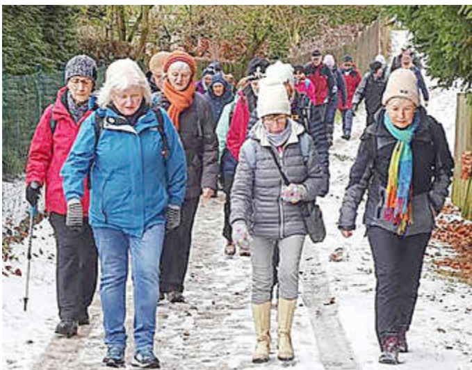
Durch die Kleingärten in Richtung Steingrundtal