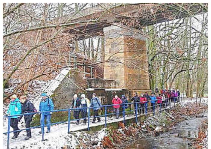
Die Bahnbrücke mit dem Widerlager der früheren Kohlebahn