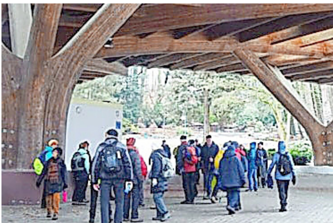
Die Wanderfreunde unter dem spektakulärem „Schmetterling“