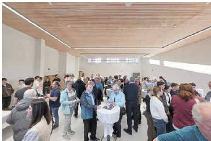
Nachher.. gesellige Runden, gute Gespräche