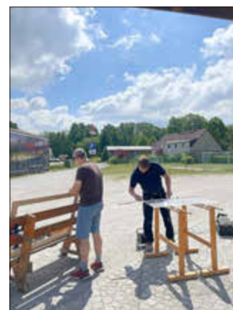
Renovierung Schautafel Herrenhaus