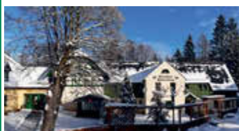
Ines Hamp Ortsgruppenleiterin Putzkau

Ich freue mich auf EUER kommen: Möchtet Ihr dabei sein, dann ruft mich bis 31.07.2026 einfach an 0152 24430850 oder per Mail: w.hamp@gmx.de