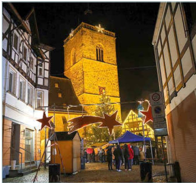
Weihnachtsmarkt Neukirchen 2023

Weihnachtsmärchen im Märchenhaus: Ein besonderes Erlebnis für Kinder und Familien – am Samstag um 14:30 Uhr entführt euch ein zauberhaftes Weihnachtsmärchen in eine andere Welt.