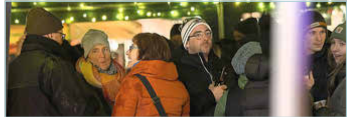
Weihnachtsmarkt Neukirchen 2023