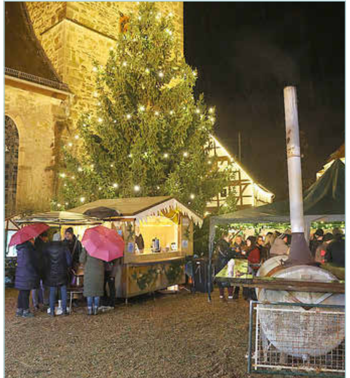
Feueriger Weihnachtsmarkt in Neukirchen

Jedenfalls ließen sich die Neukirchener auch zur Glühweinparty nicht abschrecken. Zu Beginn gegen 18:00 Uhr waren rund 400 Gäste trotz hoher Luftfeuchtigkeit auf dem Marktplatz versammelt und genossen vor allem die Feuerzangenbowle, eine Spezialität aus Neukirchen. Das überlieferte Rezept stammt aus den Anfangszeiten des Skiclubs. Mit Feuchtigkeit von innen lässt sich die Feuchtigkeit von außen perfekt ertragen. Bei den vielen Feuerschalen und vor allem der riesigen Feuertonne direkt neben dem Zelt, kam die Wärme nicht nur von innen, sondern auch von außen. (rs)