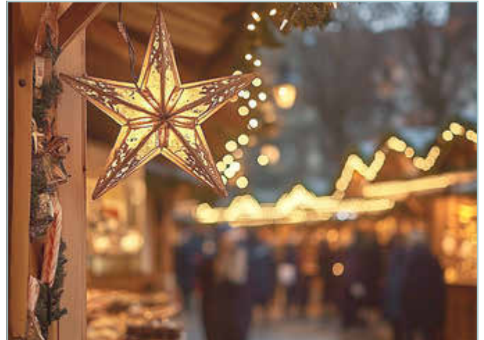
Advent heißt Ankommen!