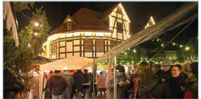
Weihnachtsmarkt Neukirchen 2023