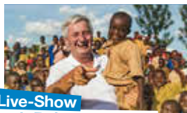
Live-Show mit Reiner Meutsch