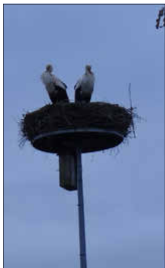
Das Storchennest in Sildemow

Text und Bilder: Sozialausschuss und VS Niendorf-Groß Stove und Gemeinde Papendorf