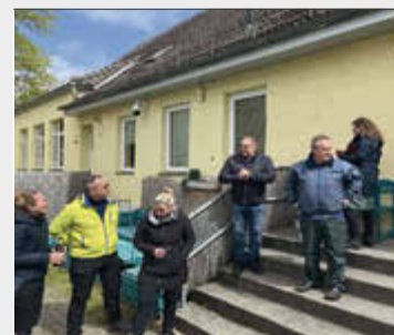
-Ansprache des Bürgermeisters-