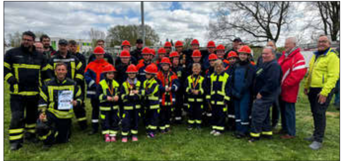
Amtsausscheid der Feuerwehren

wehren im Amt Warnow-West eindrucksvoll unter Beweis stellte.