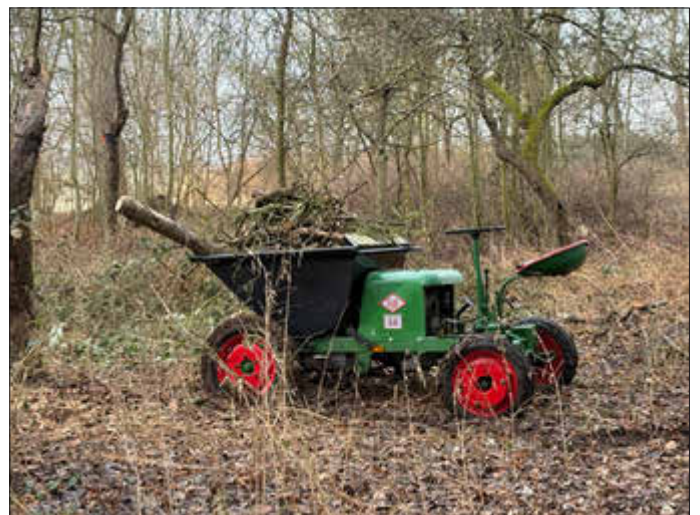
Dumper beim Frühjahrsputz der Gemeinde