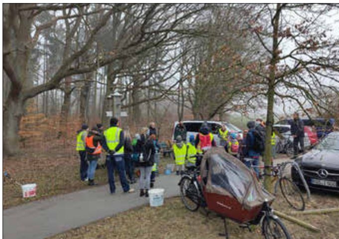
Waldputz- und Strandputztag