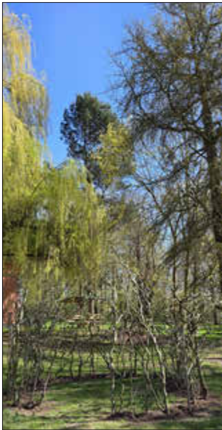
Weidentipi Kita Sonnenkäfer