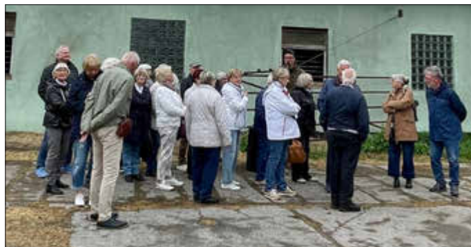
An den Stallungen