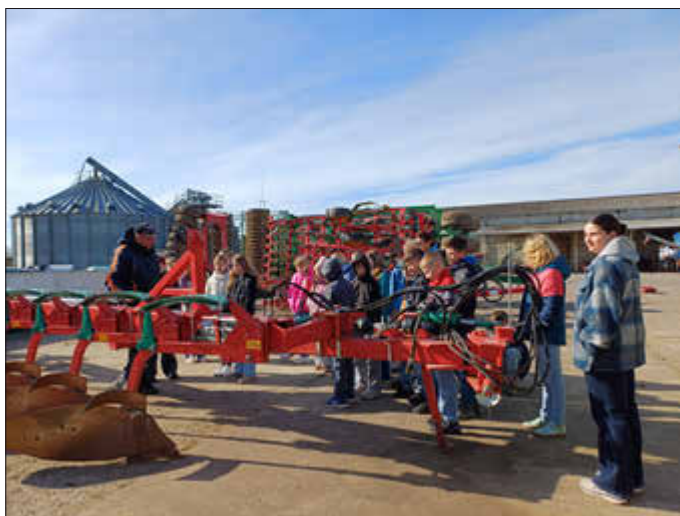
Schüler der 5. Klasse