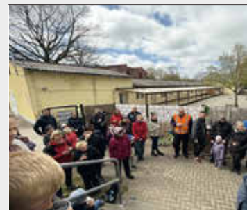
-die fleißigen Helfer-