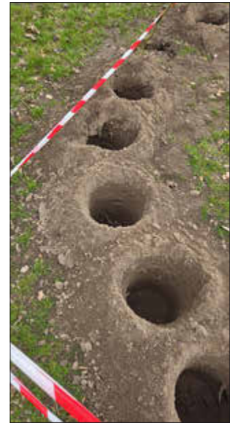
Pflanzlöcher für das Tipi

Nun heißt es warten, bis unser Dom richtig grün zuwächst und ein toller Schattenspende- und Rückzugsort für die Kids wird. Schon jetzt versteckt sich das ein oder andere Kind hinter den dünnen Zweigen und wird dann doch entdeckt.