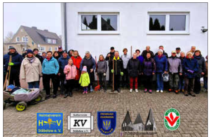
Teilnehmer Frühjahrsputz in der Gemeinde Stäbelow

Vielen Dank an alle großen und kleinen Helfer!