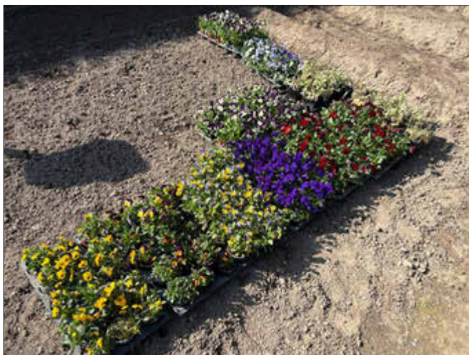
Blumen vom Gärtner