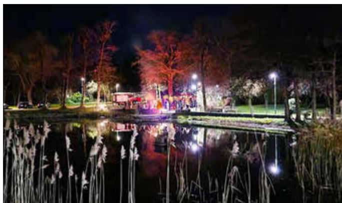
Osterfeuer 2026 Stäbelow

Die Veranstaltung verdeutlichte einmal mehr den starken Gemeinschaftssinn in Stäbelow und das große ehrenamtliche Engagement aller Beteiligten.