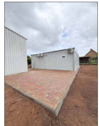
Errichtung der Raummodulanlage als Sozialtrakt