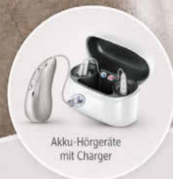
Akku-Hörgeräte mit Charger

Filiale Kyritz Marktplatz 17 16866 Kyritz 033971-679 888