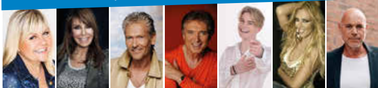
Gaby Baginsky, Ireen Sheer, Olaf Berger, Peter Orloff, Vincent Gross, Loona und Olaf Henning