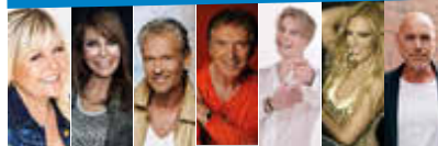
Gaby Baginsky, Ireen Sheer, Olaf Berger, Peter Orloff, Vincent Gross, Loona und Olaf Henning