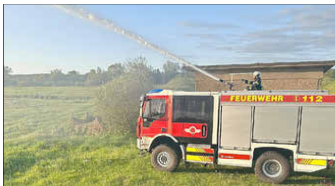
Ausbildung am Standort Marlow