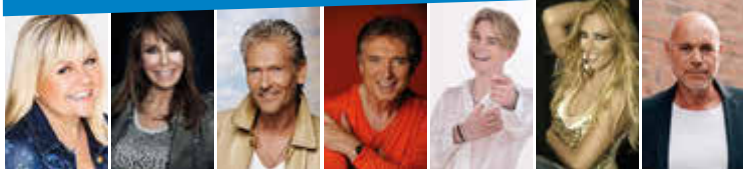
Gaby Baginsky, Ireen Sheer, Olaf Berger, Peter Orloff, Vincent Gross, Loona und Olaf Henning