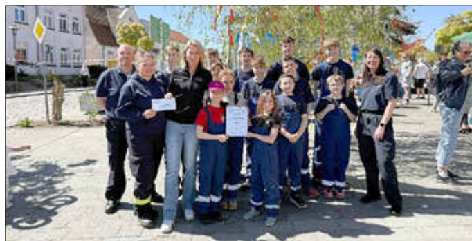
Spendenübergabe auf dem Frühlingsfest in Marlow