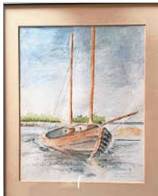
Ihre Siegrid Hensel Aquarelle