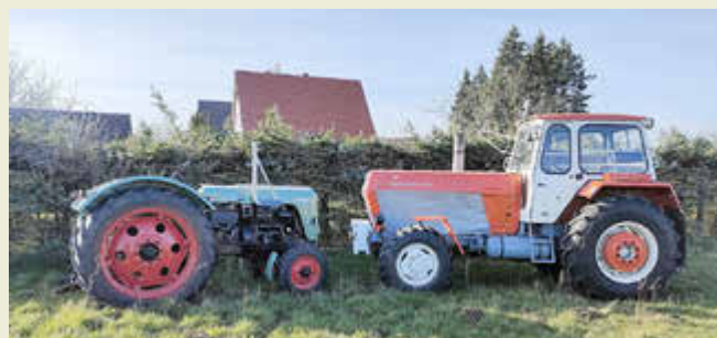
Hier ist ein kleiner Teil der Vereinstechnik zu sehen.

Natürlich ist eine entsprechende Versorgung gesichert. Ein kleines Rahmenprogramm bietet ebenfalls Unterhaltung. Auf unsere kleinen Gäste warten eine Hüpfburg und Ausfahrten. Aalwürfeln und Tauben stechen werden bestimmt mit für eine gute Stimmung sorgen.