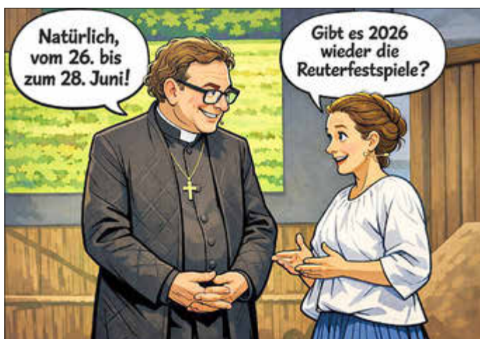
KI – generierter Beitrag

Wir freuen uns auf Ihr Kommen und den gemeinsamen Austausch!