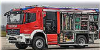
Das neue LF 20 kann vor Ort besichtigt werden.

ROSTOCKER STR.106A ; 18258 SCHWAAN GERÄTEHAUS FF SCHWAAN