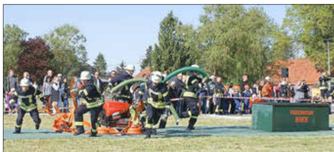
Löschgriff der Erwachsenen

Die Erwachsenen treten in zwei Disziplinen an. Die erste Disziplin ist der Traditionelle Wettbewerb, wobei in A- und B-Wertung unterschieden wird. D.h. sind alle Wettbewerber über 30 Jahre alt, bringt ein hohes Durchschnittsalter der Mannschaft Gutpunkte. Früher etwas exotisch, sind heute jeweils drei Mannschaften beim CTIF (A) und (B) am Start. Beim Löschgriff (nass) muss zunächst eine Saugleitung zu einem Wasserbehälter hergestellt werden. Zeitnah kuppeln andere Kameraden Druckschläuche und Verteiler aneinander und legen die 90 Meter Schlauchstrecke aus. Am Bahnende warten zwei Zieleinrichtung, die die Zeit stoppen lassen sobald eine ausreichende Menge Wasser im Reservoir ist.