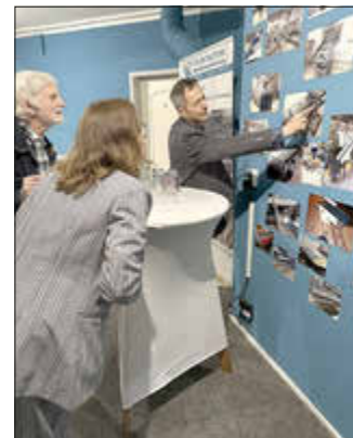
Text/Fotos: Stadt Grabow