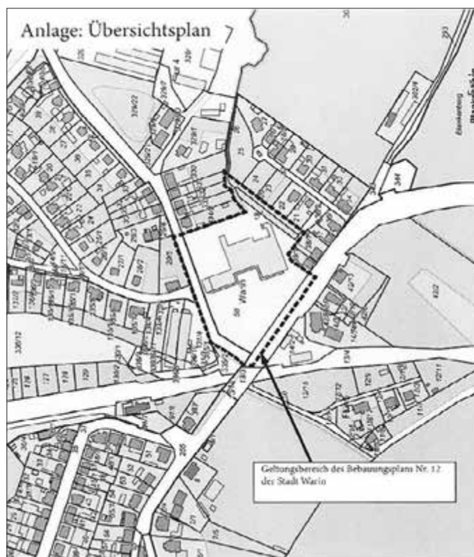
Geltungsbereich der 6. Änderung des Bebauungsplanes Nr. 12 „Einkaufszentrum Bützower Straße“