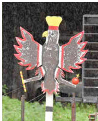
Der hölzerne Aar