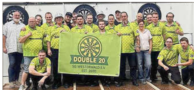
Das Darts Team Double 20 der SG Westerwald beim Deutschland-Pokal auf Rang 5.

Durch den Gewinn des NWDV-Pokals hatte sich die Dartabteilung von Double20 SG Westerwald für den Deutschen Verbandspokal des DDV qualifiziert und durfte den Nordrhein-Westfälischen Dartverband auf Bundesebene vertreten. Bereits die Anreise zeigte, welchen Stellenwert dieses Turnier für den Verein hatte. Mit einem Kader von 15 Spielern und einer großen Anzahl an Unterstützern reiste Double20 mit knapp 30 Personen an und stellte damit eine der größten Delegationen des gesamten Turniers. Die Unterstützung sorgte den ganzen Tag über für eine besondere Atmosphäre und machte das Event zu einem echten Gemeinschaftserlebnis.