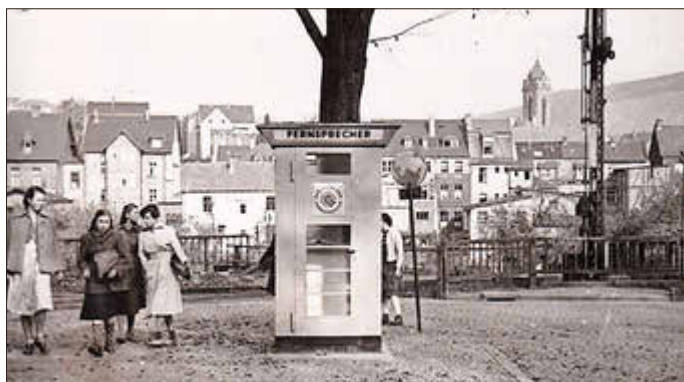
Betzdorfs erste Telefonzelle stand auf dem Bahnhofsvorplatz.

Ein Telegraphenbauamt gab es dort ab 1900. Eingerichtet wurde ein Fernsprechnetz mit zunächst 48 Teilnehmern, es gab Fernsprechleitungen nach Koblenz und nach Köln. Nach Siegen wurde am 22. Februar 1901 eine Leitung eingerichtet, Dauersberg erhielt 1914 als letzter Ort der Gemeinde Betzdorf einen Netzanschluss.