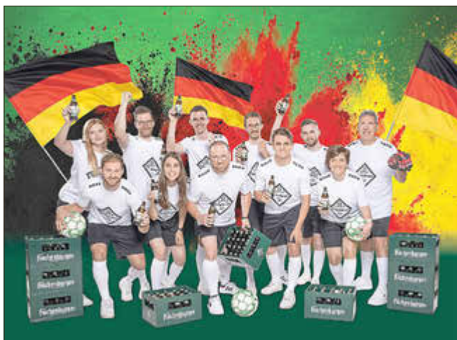
Die Hachenburger Elf rückt aus und verdoppelt das gute Hachenburger im Haus.

Für alle Fußballfans heißt es daher ab sofort: Vorrat prüfen, registrieren und auf Besuch der Hachenburger Elf hoffen. Denn wo gutes Hachenburger steht, kann die Hachenburger Elf jederzeit für eine Verdoppelung sorgen. Das gilt natürlich für alles von Hachenburger, auch für Hachenburger Cola, Limmo und Kalter Kaffee natürlich.