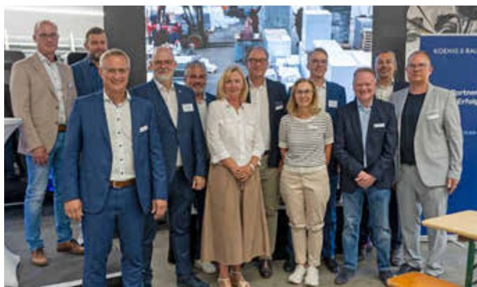
▲ LINUS WITTICH und Koenig & Bauer arbeiten gut zusammen.