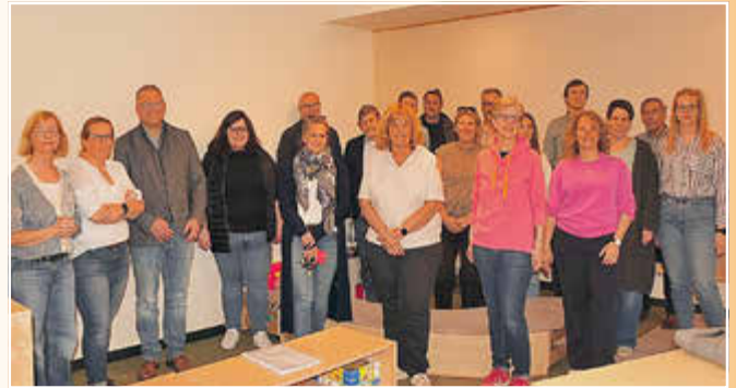
Die neue Gruppe wurde gemeinsam besichtigt.