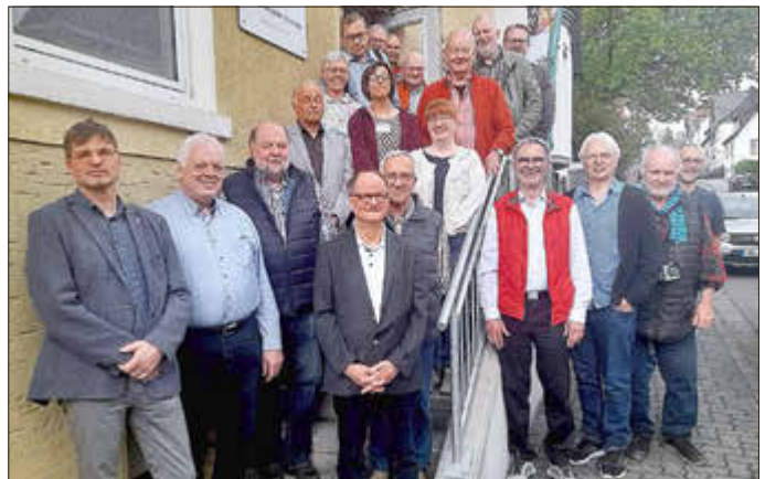
Zum Abschluss des Treffens der Autorinnen und Autoren gab es noch ein Gruppenfoto auf der Treppe des Hauses in der Bismarckstraße.