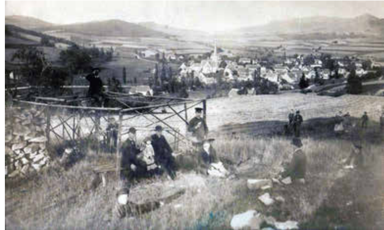
Alt Poppenhausen vom Schießkuppel

reservats Rhön zieht Poppenhausen zahlreiche Besucher an. Mit rund 110.000 Übernachtungen jährlich zählt die Gemeinde zu den bedeutendsten Urlaubszielen der Region. Wanderwege, Sportanlagen, Themenpfade und der Nordic Walking Panorama-Park machen den Ort zu einer vielseitigen Natursportgemeinde.