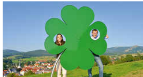
Glückskleeblatt am Liebesweg