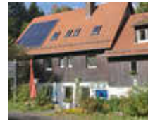
Waldgasthof „Zum Wachtküppel“