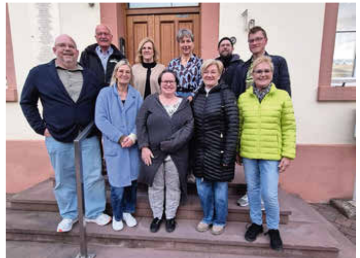
Vorstand des Fördervereins

KONTAKT: mail@leben-und-arbeiten-in-poppenhausen.de