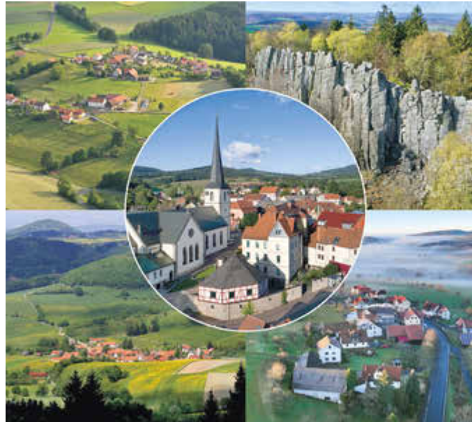
Mitte: Kernort: (zu sehen: die Kirche mit Pfarrhaus und Bücherei im Vordergrund) | Rechts oben: Steinwand (zu sehen: der Felsen) | Rechts unten: Rodholz | Links oben: Gackenhof | Links unten: Abtsroda (zu sehen: Sieblos)

Abtsroda liegt direkt am Fuße der Wasserkuppe, der Abtsrodaer Kuppe und dem Weiherberg und verbindet Natur und Tourismus sowie Traditionsbewusstsein und Zusammenhalt. Prägend ist auch das ortsansässige Palettenwerk. Die Ortsteile Sieblos mit eigener Kirche und Tränkhof mit seiner kleinen Kapelle besitzen bis heute ihren unverwechselbaren, eigenständigen Charme.