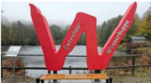
„W“ am Guckaisee