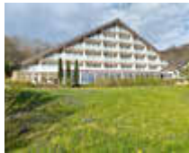
Sure Hotel Rhön Garden