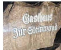
Gasthaus Zur Steinwand