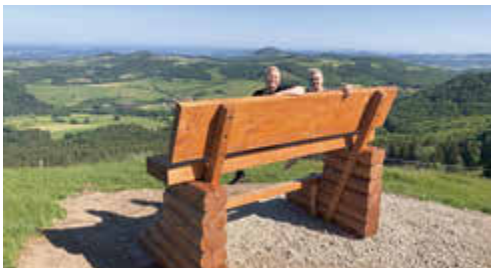
Baumelbank am Pferdskopf + Wanderung Nr. 1

Neben den herrlichen Panoramablickten, die Poppenhausen (Wasserkuppe) zu bieten hat, laden unsere fünf Selfiepoints der Gemeinde an besonderen Standorten den Besucher dazu ein, tolle, lustige oder kreative Erinnerungsfotos zu machen.