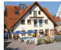
Bio Hof Gensler