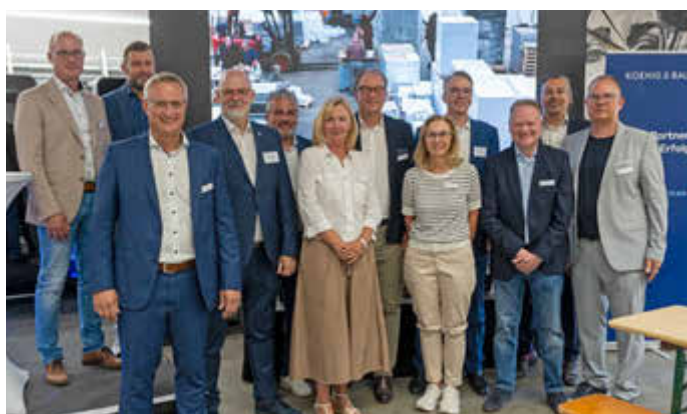
▲ LINUS WITTICH und Koenig & Bauer arbeiten gut zusammen.