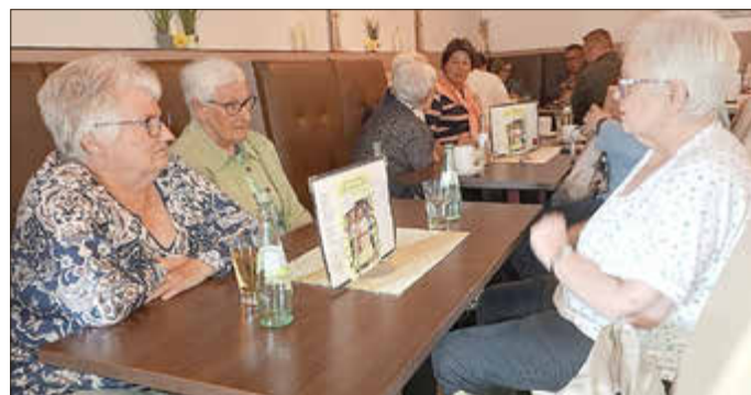
Einige der Besucher beim letzten VdK-Stammtisch

Zu seinem nächsten Stammtisch lädt der VdK-Ortsverband Bad Hönningen-Rheinbrohl am Donnerstag, den 09.07.2026, ein. Dieser findet um 15:00 Uhr im Gasthaus von „Geimers Finest Eiscreme & More“ statt. Es wird erneut eine reichhaltige Auswahl an frisch zubereiteten Kuchen angeboten.