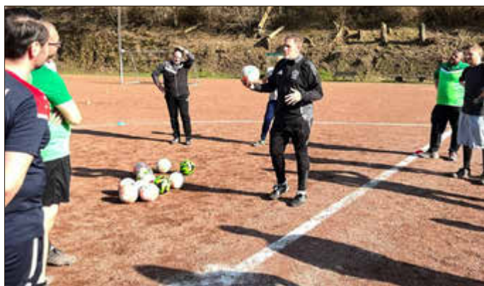
Trainer verschiedener Vereine auf dem Sportplatz Leubsdorf bei einem Lehrgang im Jahr 2025.

Der SV Leubsdorf wird selbst mit neun Trainern an der Ausbildung teilnehmen. Gleichzeitig lädt der Verein alle Vereine aus der Umgebung herzlich ein, in den eigenen Reihen für den Lehrgang zu werben und interessierte Trainer oder Anwärter nach Leubsdorf zu schicken.