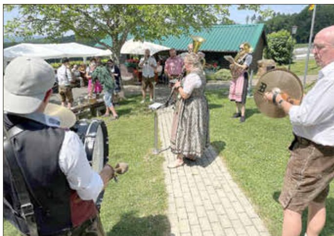
Beliebte Stammgäste an der Erler Berghütte: Die „Kuhlen Musikanten“.