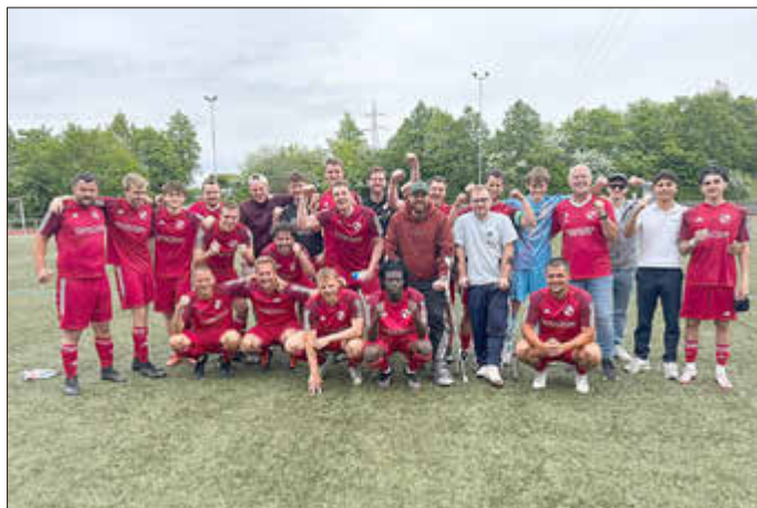
Die 1. Mannschaft nach dem 3:0 Sieg beim SV Windhagen II

Das war der 1. Auswärtssieg in dieser Saison und hart erarbeitet. Die Leistung war so oh lala und man konnte nicht an die Glanzleistung wie gegen den VfB Linz II (3:3) anknüpfen. Am Ende zählen aber nur die 3 wichtigen Punkte. Somit hat man es noch selbst in der Hand, um die Klasse zu halten.