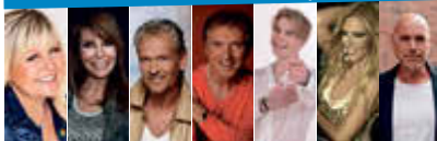
Gaby Baginsky, Ireen Sheer, Olaf Berger, Peter Orloff, Vincent Gross, Loona und Olaf Henning