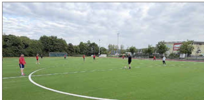
Nach langer Zeit kann der Ball endlich wieder rollen.

Unter dem Motto „Damit der Ball in Unkel wieder rollt.“ hat sich im November 2024 die Stiftung Jugend, Sport und Integration (JSI) gegründet, um gemeinsam mit der Stadt Unkel am bisherigen Standort des Unkeler Sportplatzes den unbespielbaren Hybridplatz durch einen hochwertigen Kunstrasenplatz zu ersetzen. Mit vielen Spenden aus der Bürgerschaft sowie von Firmen, anderen Stiftungen und wohlwärtigen Spendern konnte im Herbst 2025 die notwendige Bau- summe gemeinsam mit der Stadt Unkel aufgebracht werden, sodass der Bauauftrag seitens der Stiftung JSI erteilt werden konnte.