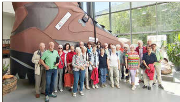
Die Gruppe des Rheinbreitbacher Obst- und Gartenbauvereins vor dem größten Schuh der Welt im Schuhmuseum Hauenstein.