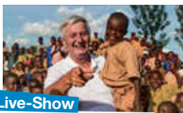
Live-Show mit Reiner Meutsch