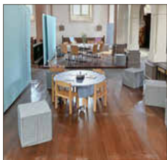
KinderKreativRaum und Kultur und Kaffee

Die ersten Aktionen der Kehriger kirchRAUMpilot*innen sind gut gestartet. An einem schönen Kircheswochenende wurden die drei Pilotprojekte vorgestellt und