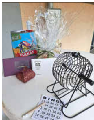
Am Sonntag waren alle im Bingo-Fieber

Traditionell fand das Junggesellenfest in Monreal am zweiten Wochenende nach Ostern statt. Aufgrund der immer stärker zurückgehenden Besucherzahlen wurde das Fest in diesem Jahr etwas umgestaltet. So startete das Festwochenende am Samstag mit dem traditionellen Festumzug, der sich wieder quer durch den Ort schlängelte. Neben den Monrealer Junggesellinnen und Junggesellen, die in ihren Fracks und Zylindern bzw. den weißen Blusen mit schwarzem Rock oder Hose, wieder ein besonders gutes Bild abgaben, nahmen auch wieder einige befreundete Gastvereine am Umzug teil. Musikalisch wurde der Umzug wie gehabt von der Burgkapelle Monreal begleitet und von der Freiwilligen Feuerwehr abgesichert. Nach der Präsidentenabholung, der wie gewohnt viele Zuschauer beiwohnten, ging es zur Totenehrung mit Kranzniederlegung auf den Friedhof. Im Anschluss ging es durch den historischen Ortskern zurück zur Gemeindehalle. Dort hieß es: Tore auf für die erste Spring BeatZ-Party. Hier war für jeden etwas dabei, denn man konnte seine Musikwünsche per QR-Code direkt an DJ Ahro weiterleiten, der es genau verstand, das bunt gemischte Publikum bestens zu unterhalten. So wurde bis in die frühen Morgenstunden ausgelassen gefeiert. Am Sonntagmorgen ging es dann mit einem Wortgottesdienst, geleitet von Willi Brück, weiter.