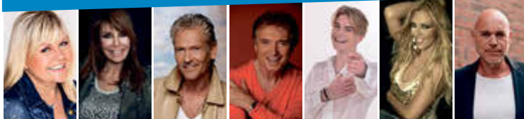
Gaby Baginsky, Ireen Sheer, Olaf Berger, Peter Orloff, Vincent Gross, Loona und Olaf Henning