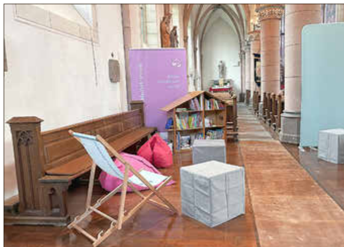
Bücherwurm unterm Kirchturm

Weitere Termine bitte vormerken: 07.06.2026, Kultur und Kaffee: 15:00 Uhr Technik früher und heute 21.06.2026, Kultur und Kaffee: 15:00 Uhr fröhliche Sommer-sonnenwende