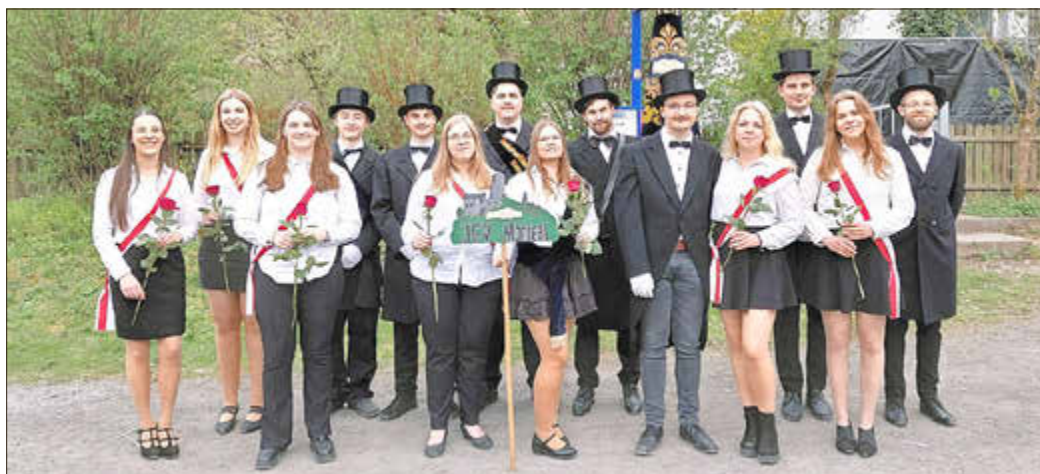
Die Mitglieder des Junggesellenvereins nach dem Festumzug.

Der JGV 1844 Monreal e. V. hat die Aufgabe, die Gemeinschaft der jungen Leute in der Ortsgemeinschaft von Monreal zu fördern. Dazu finden über das komplette Jahr regelmäßig gemeinsame Aktivitäten statt. Die Mitglieder erfreuen sich an Geselligkeit und engagieren sich dabei aktiv im Ortsleben. Über neue Mitglieder (ab 16 Jahren) freut sich der Verein immer!