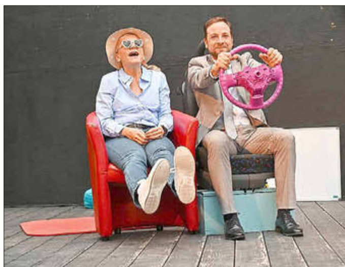
Lesung zu „Achtsam Morden“ am 25. Juni

Mayen. Die Burgfestspiele Mayen begeistern auch in diesem Jahr mit einem spannenden Programm, das Kulturgenuss und literarische Vielfalt verbindet. Unter anderem zu sehen: Das Stück ‚Achtsam Morden‘ auf der ‚Kleinen Bühne der Burgfestspiele‘, zu dem die Karten bereits ausverkauft sind. Einen Termin gibt es aber noch zu erleben: Eine exklusive Lesung zu ‚Achtsam Morden‘ mit Schauspieler*innen der Burgfestspiele in der Stadtbücherei Mayen.