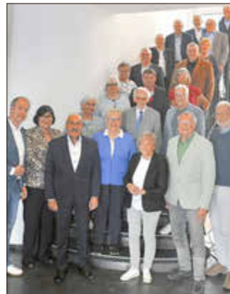
Die konstituierende Sitzung des Landesvorstands der Senioren Union fand in Mainz statt.

Mit der Fusionierung können die Vereine nun auf ein großes Trainer-Repertoire zugreifen und zukunftsorientiert sowie -/sicher mit mehreren Jugendmannschaften planen. Mit zwei Rasenplätzen in der Hinterhand sowie dem geplanten Kunstrasenplatz im kommenden Jahr in Spessart erhofft man sich zusätzlich eine Attraktivitätssteigerung. Für die kommende Saison werden je zwei leistungsbezogene Mannschaften für die F-/E-/ und D-Jugend gemeldet, neben einer C-Jugend wird zudem für den älteren Jahrgang eine U18 gemeldet.