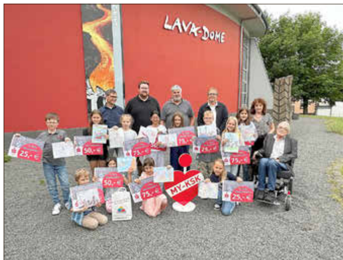
Gruppenbild mit glücklichen Gewinnerinnen und Gewinnern des Malwettbewerbs der Kreissparkasse Mayen und der Vulkanpark GmbH.

„Ich danke allen, die am Malwettbewerb teilgenommen haben. Ihr seid im besten Sinne ebenfalls Botschafter unserer Region und insbesondere natürlich für alle jungen Besucherinnen und Besucher hier im Lava-Dome und im Lavakeller“, lobten Joachim Plitzko und Achim Grün die jungen Künstlerinnen und Künstler.