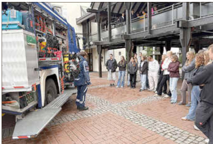
Der Gerätekraftwagen – das Herzstück vieler THW-Einsätze. Jedes Fach hat seine Aufgabe, jedes Gerät seinen Zweck.