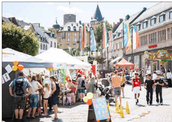
Das Kinderfest lädt am 20. Juni in die Mayener Innenstadt ein

Die Besucherinnen und Besucher erwarten vielfältige Aktivitäten wie kreative Mitmachaktionen, Bastelangebote, Spielstationen und die beliebte Stempelaktion quer durch die Innenstadt. Wer fleißig Stempel sammelt, kann an einer Verlosung teilnehmen und attraktive Preise gewinnen. Als Hauptpreise winken MY-Gutscheine im Wert von 50 Euro, 25 Euro und 10 Euro. Darüber hinaus werden verschiedene Sachpreise verlost.