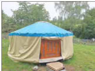
Die neue Jurte sorgte für viele begeisterte Kinderaugen

Stolz berichteten sie über erkannte Blitzschäden an den Bäumen, Wildplätze, Baumarten, Fuchsbauten und Spechtsschmieden. Die Vertrautheit der Kinder mit dem Wald spiegelte sich in dem sicheren Auftreten vor vielen Menschen wider.