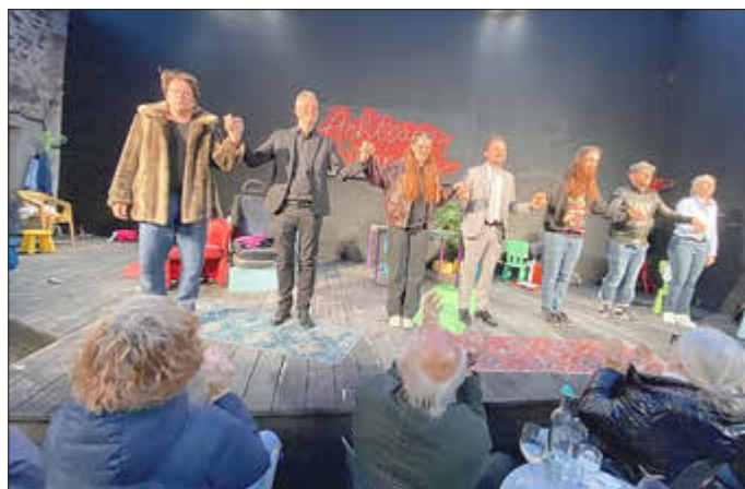
Auch alle, die hinter den Kulissen bei der Premiere von Achtsam morden mitwirken, erhielten einen verdienten Beifall