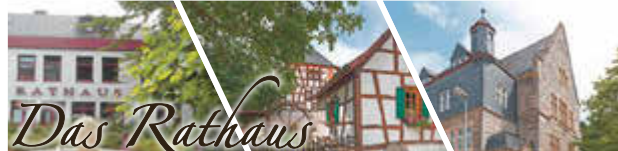
Bretzenheim, Dakweiler, Dorsheim, Dörrebach, Eckenroth, Guldental, Langenlonsheim, Laubenheim, Roth, Rümmlsheim, Schöneberg, Seibersbach, Stadt Stromberg, Schweppenhausen, Waldlaubersheim, Warmstroth, Windesheim

Jahrgang 51 | Nummer [week] | Freitag, [date]