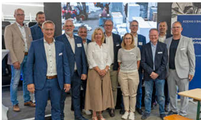
▲ LINUS WITTICH und Koenig & Bauer arbeiten gut zusammen.