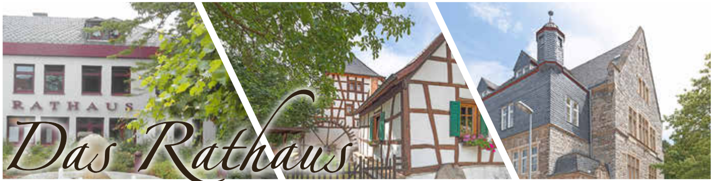
Bretzenheim, Daxweiler, Dorsheim, Dörrebach, Eckenroth, Guldental, Langenlonsheim, Laubenheim, Roth, Rümmelsheim, Schöneberg, Seibersbach, Stadt Stromberg, Schweppenhausen, Waldlaubersheim, Warmsroth, Windesheim

Die Freiwillige Feuerwehr Seibersbach und der Förderverein Freunde der Feuerwehr Seibersbach e.V. laden ein