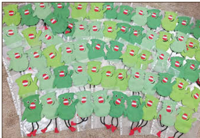
Die genähten „Wir“-Figuren

Aus der Kita Kunterbunt gibt es wieder schöne Neuigkeiten – und diesmal mit einem ganz besonderen Gemeinschaftsprojekt: Gemeinsam mit den Landfrauen Beuerbach ist für jedes Kind ein liebevolles „Wir“ aus Filz nach dem Vorbild von „Das kleine Wir“ entstanden.