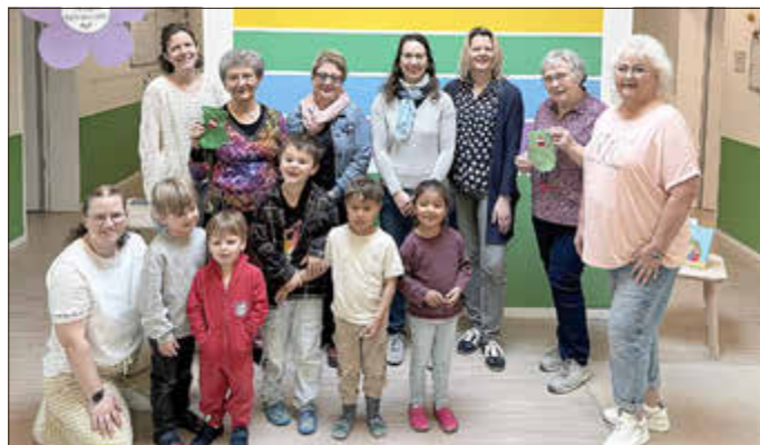
Ein Teil der beteiligten Helfer mit einigen Kindern in der Kita Kunterbunt

kleinen Figuren in gemeinsamer Arbeit mit viel Geschick, Erfahrung und Herzblut entstehen konnten. So wurde aus vielen einzelnen Beiträgen ein echtes Gemeinschaftswerk, das den Gedanken des Miteinanders auf wunderbare Weise widerspiegelt. Das kleine „Wir“ ist den Kindern der Kita dabei bereits sehr bekannt. Schon seit dem vergangenen Sommer begleitet es die Kinder im Alltag, bei besonderen Projekten und an Feiertagen. Das kleine „Wir“ steht für Freundschaft, Zusammenhalt und das Gefühl, füreinander da zu sein.