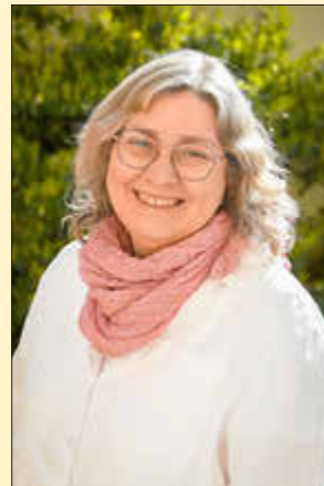
Gemeindepädagogin Renate Feick

Während sie aus großer Distanz auf die Erde schauten, schwärmten sie von der Schönheit des Planeten, und auch von der eindrücklichen Perspektive auf das tiefe und dunkle Schwarz um die Erde herum. Christina Koch, Astronautin und Langzeitbewohnerin der Internationalen Raumstation ISS, schrieb nach ihrer Rückkehr zur Erde: „Planet Earth: you are a crew. Planet Earth: Ihr seid ein Team“ Sie sah unseren Planeten von oben, mit Abstand. Und sie sah keine Grenzen, keine Nationen – nur eine leuchtende, zerbrechliche Kugel, auf der alles Leben voneinander abhängt.