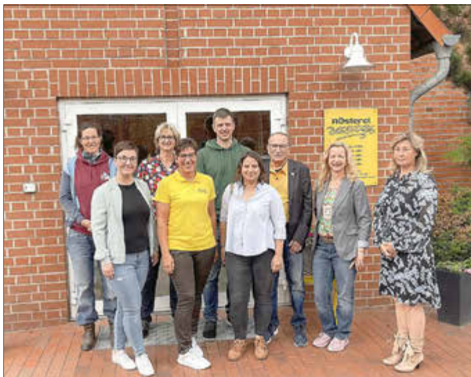
Teilnehmende Siegelträger des Netzwerktreffens im gemeinsamen Gruppenfoto.

Mit dabei waren unter anderem Küppers Altmärker Wildfrucht aus Behrendorf, MY Unverpackt sowie die Kaffeerösterei Besonders aus Stendal, Hand & Huf aus Poppau, das ArtHotel Kiebitzberg aus Havelberg, die Wallstawe eGBR | Lager 72 aus Wallstawe, Hof Tendler aus Jeseritz sowie das Restaurant „Zur Güldenen Pfanne“ aus Havelberg.