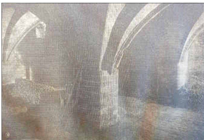
Klosterkeller

Tangermünde besitzt eine Vielzahl meisterhaft gebauter Keller unter den alten Bürgerhäusern. Aber keiner kann sich mit dem unterirdischen Gewölbe auf dem Klosterberg vergleichen. Der schönste mittelalterliche Keller von Tangermünde liegt direkt unter dem Klausurgebäude des ehemaligen Dominikanerklosters. Auch der Keller des historischen Rathauses kann einem Vergleich mit dem Klosterkeller nicht standhalten. Dort ist lediglich ein rotes Tonnengewölbe nachträglich in den unteren Saal - der einstigen Markthalle - eingezogen worden, als sich der Boden um das Rathaus herum durch Aufschüttung immer mehr hob. Beim Dominikanerkloster sind der Keller und der darüberliegende gewölbte Raum aus einem Guss gestaltet. Im Klosterkeller trägt ein Mittelpfeiler von 74 cm Durchmesser ein meisterhaftes Kreuzrippengewölbe, das an das Gewölbe des Festsaals des historischen Rathauses erinnert.