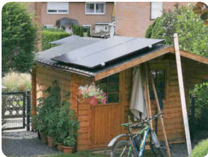
PV-Module auf einem Gartenhaus

In zahlreichen Fotos wird gezeigt, welche unterschiedlichen - teils überraschende - Möglichkeiten es gibt, PV-Module zu installieren und den eigenen Strom zu produzieren. Auch die Bürger-Solarkraftwerke Rosengarten eG stellt neue Projekte der Versorgung mit PV auf kommunalen Dächern vor. Hier sei an das Leuchtturmprojekt der Genossenschaft in Neu Wulmstorf erinnert: die erfolgreiche Inbetriebnahme der PV-Anlage der Grundschule am Moor. Weitere große Anlagen sind auf Dächern der Gemeinde Neu Wulmstorf in Planung! Damit besteht für alle die Möglichkeit, sich auch ohne ein eigenes Balkonkraftwerk an der Erzeugung von klimaneutralem Strom zu beteiligen: einfach Mitglied der der Bürger-Solarkraftwerke Rosengarten e.G. werden!