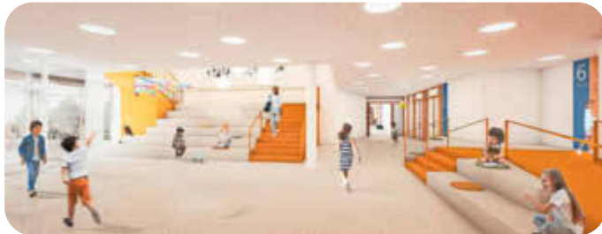
Visualisierung vom Eingangsbereich der Grundschule An der Heide

Der Bauantrag für das Vorhaben soll noch in diesem Jahr beim Landkreis Harburg eingereicht werden. Mit den Abbrucharbeiten des heutigen Schulgebäudes wird schon zu Beginn des Jahres 2025 begonnen. Ab Ende April 2025 wird dann zunächst die Kindertagesstätte HeideBären neu gebaut, damit im Sommer 2026 ein Umzug der Kindertagesstätte von den alten in die neuen Räumlichkeiten erfolgen kann. Der Neubau der Grundschule wird Anfang Oktober 2026 fertiggestellt, sodass ein Umzug in den Herbstferien erfolgen kann. Insgesamt ist die Fertigstellung des Bauvorhabens für Ende Januar 2027 geplant.