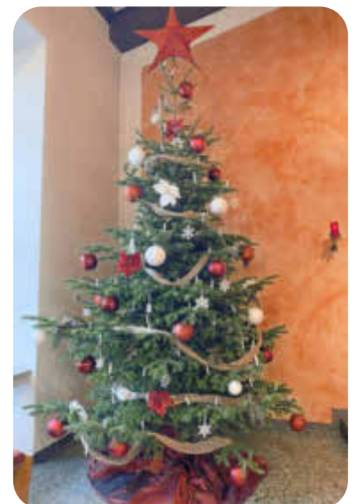
geschmückten Tannenbaums in der St. Josefs Kirche Neu Wulmstorf

Wir sind die älteste christliche Gemeinde hier im Ort. Aufgebaut von Flüchtlingen aus den Ostgebieten, die hier eine neue Heimat fanden und ganz selbstverständlich eine Kirche bauten, um ihren Glauben zu leben. Ein Ort, der bald zu einem neuen Zuhause wurde. Es gab damals viel Mangel und viel Enthusiasmus. Die Geschichte wiederholt sich gerade, denn aktuell mangelt es an Priestern.