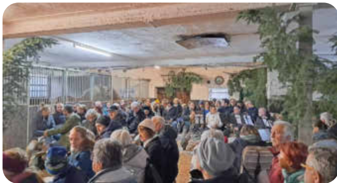
Stallandacht am 26.12.2023