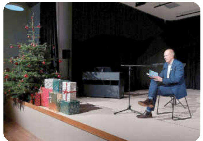
Seniorenweihnachtsfeier - Bürgermeister Tobias Handtke hat eine Geschichte vorgelesen.

Der feierliche Nachmittag fand nun schon zum zweiten Mal im festlich geschmückten Veranstaltungszentrum der Grundschule am Moor statt. Fleißige Bastelwichtel aus der Grundschule an der Heide sorgten dieses Jahr für eine stimmungsvolle Tischdekoration.