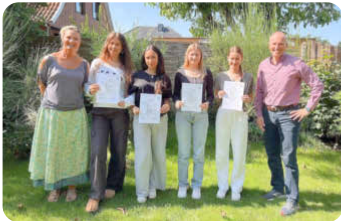
Teilnehmer Babysitter-Workshop 2024

Ein besonderer Schwerpunkt lag auf den entwicklungspsychologischen Grundlagen, die den Mädchen ein tieferes Verständnis für die Bedürfnisse von Kindern in unterschiedlichen Altersstufen vermittelt. Zusätzlich erhielten sie ein wertvolles Coaching, um souverän mit schwierigen Betreuungssituationen umgehen zu können.