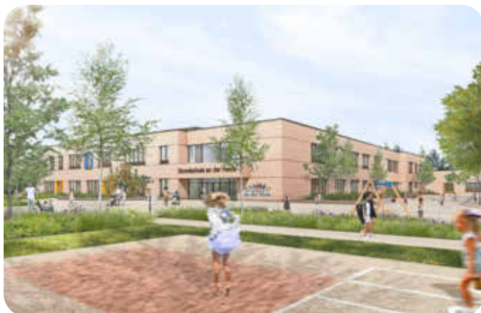
Visualisierung vom Sportbereich und der Ansicht der Grundschule im Hintergrund