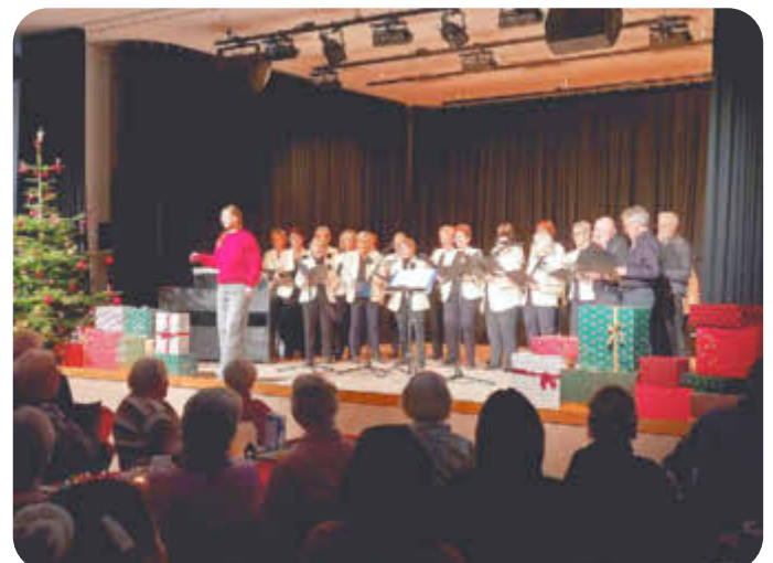
Seniorenweihnachtsfeier - Auftritt gemischter Chor