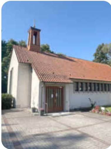
Kirche von außen

Unsere engagierten Gemeindemitglieder bilden somit das Herzstück dieser Projekte, da sie ihre Zeit und Freude in unsere christliche Gemeinschaft stecken.