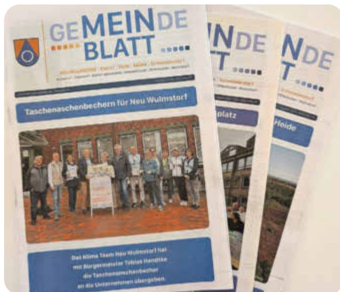
Mein Blatt; verschiedene Ausgaben

Die Gemeinde Neu Wulmstorf freut sich, Ihnen die Neuaufgabe von „Mein Blatt“ ankündigen zu dürfen. Ab März 2025 erscheint die Zeitung im neuen Format und mit einem überarbeiteten Verteilverfahren. Zukünftig wird „Mein Blatt“ ab März alle zwei Monate kostenlos an zentralen Ausgabestellen in der gesamten Gemeinde verfügbar sein.