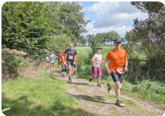
Rosengartenlauf 2024 - Teilnehmende des Viertelmarathon X-TREME auf der Strecke

Am 31. August 2025 werden am Wildpark Schwarze Berge der 6. Rosengartenlauf und der 5. Rosengarten ULTRA Heide Marathon (RUHM) stattfinden. Das ist noch eine ganze Zeit hin, anmelden kann man sich für das große Laufevent der Hausbruch-Neugrabener Turnerschaft (HNT) durch den Regionalpark Rosengarten aber schon heute. Seit dieser Woche ist die Onlineanmeldung freigeschaltet. Und die ersten haben sich ihren Startplatz für 2025 auch schon gesichert: „Das hat tatsächlich nicht lange gedauert, bis die ersten Anmeldungen bei uns eingegangen sind“, berichtet HNT-Pressesprecher Alexander Mohr. „Es lohnt sich aber auch, weil es die Startplätze bis 31. Dezember 2024 noch zum günstigen Frühbucheerpreis gibt.“