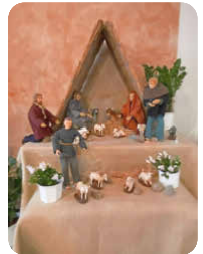
Krippe in der Kirche