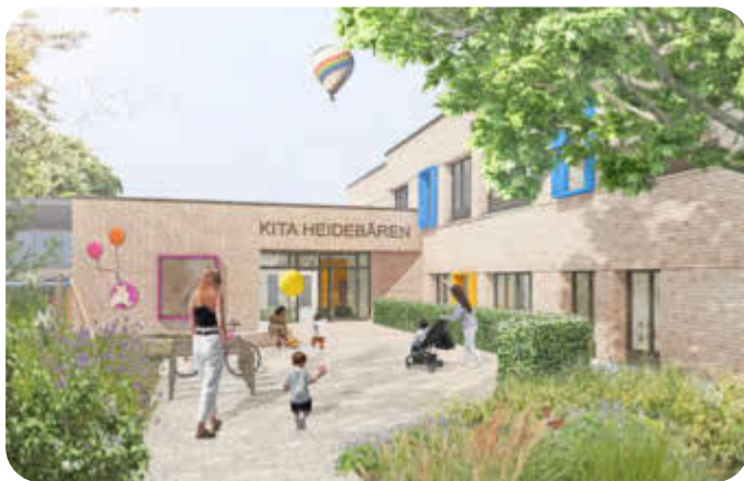
Visualisierung vom Eingangsbereich der Grundschule An der Heide