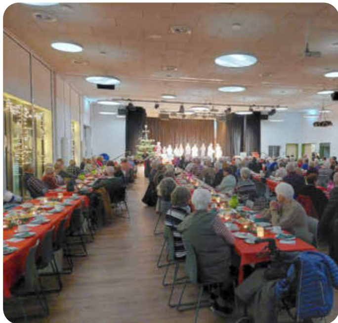
Seniorenweihnachtsfeier - Blick vom Saal auf die Bühne