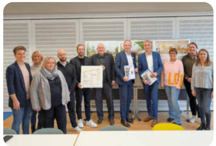
Viele beteiligte Personen bei der Vertragsunterzeichnung für die Grundschule An der Heide