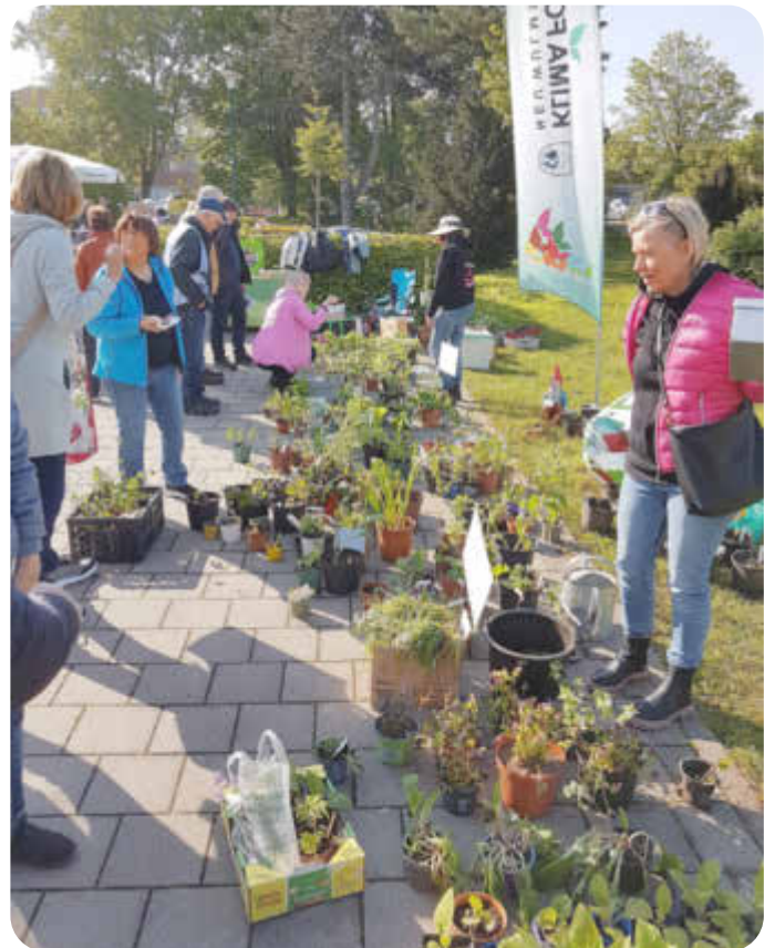
Pflanzenmarkt April 2024