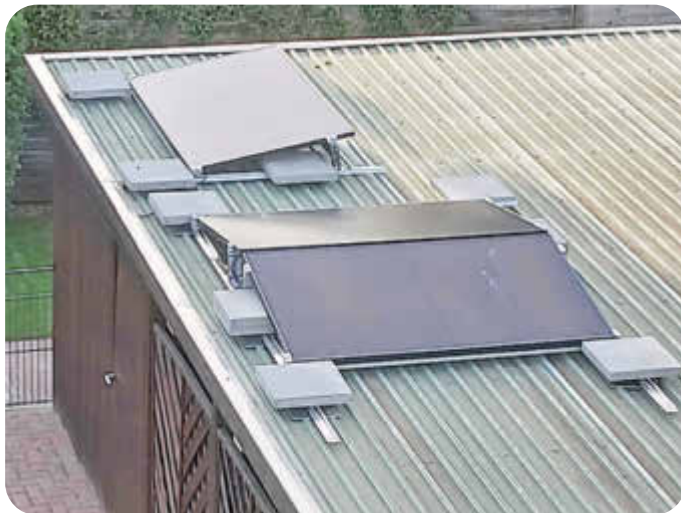
3 PV-Module auf einem Garagendach

(SR) Am 20. November fand im SoVD-Treffpunkt im Lichthof die letzte Monatsversammlung im Jahr 2024 statt. Vor zahlreichen SoVD-Mitgliedern und interessierten Gästen informierte der Bürgermeister Tobias Handtke (SPD) über Wissenswertes aus der Gemeinde Neu Wulmstorf.