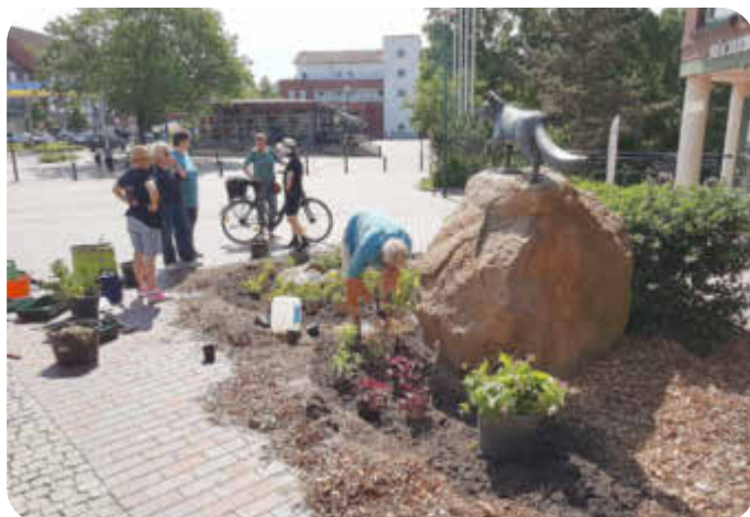
Rathausbeet Mai 2024

KlimaTeam „Blühendes Neu Wulmstorf“ bluehendesnw@klimaforum-neu-wulmstorf.de