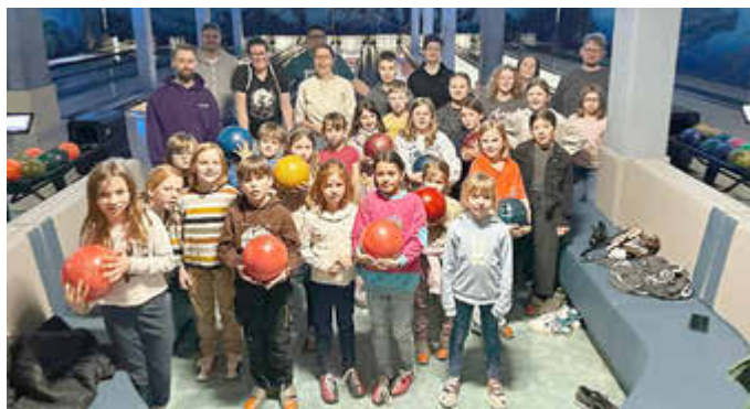
Der TBO-Nachwuchs hatte viel Spaß beim Bowling.

Zwei Stunden lang wurde auf insgesamt sechs Bahnen gespielt, gelacht und angefeuert. Verschiedene Bowling-Varianten sorgten für Abwechslung