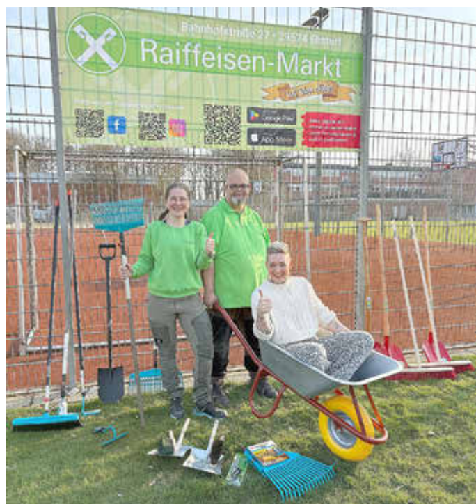
Die gespendeten Gartengeräte konnten gleich zum Einsatz kommen.