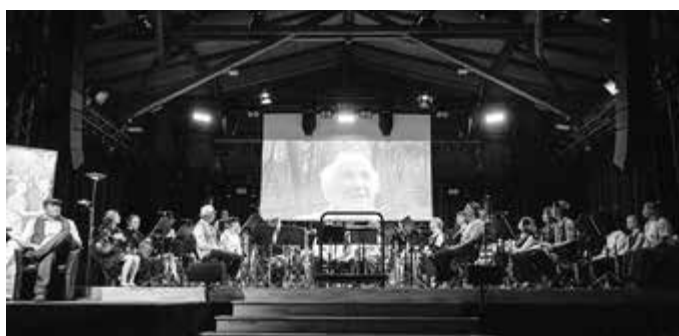
Lottes fiktive Lebensgeschichte zog sich wie ein roter Faden durch das TBO-Konzertprogramm in Wienebüttel.