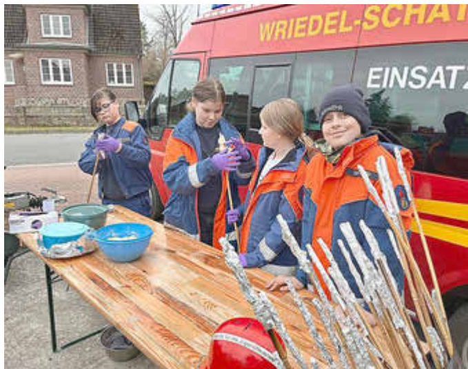
Die Jugendfeuerwehr hatte sich gut gerüstet für unzählige Stockbrotportionen, die später auch gern genommen wurden.