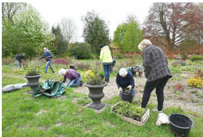
Es war ein arbeitsreicher ehrenamtlicher Einsatz, um dem historischen Klostergarten wieder zu Schönheit zu verhelfen.

Es war ein schönes Miteinander, alle hatten Freude am Arbeiten und an den Gesprächen, die sich entwickelten. „Es hat richtig Spaß gemacht“, so eine Teilnehmerin, die sogar aus Scharnebeck gekommen