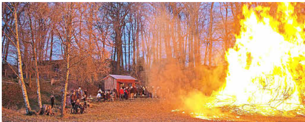
Die Besucher hielten respektvollen Abstand. Man war ja schließlich kein Grillwürstchen!

Inzwischen gibt es Osterfeuer in den meisten Ortshäfen des Kreises Uelzen und in Schwienau in jedem Ortsteil. Linden und Stadorf gehen dabei den Weg des geringsten Widerstandes und halten ihre Feuer in überschaubarer Größe. Imposanter sind hingegen dieje-