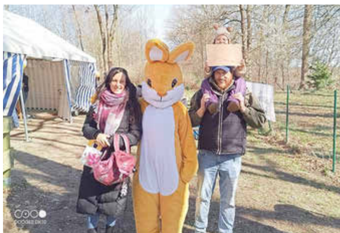
Kinder und Erwachsene hatten viel Spaß in der bunten Osterlandschaft des Quad und ATV Clubs Lüneburger Heide e.V.

Um 14 Uhr startete die Eiersuche für die Kinder. Über das gesamte Gelände verteilt hatte der „Osterhase“ zahlreiche bunte Eier versteckt. Mit viel Begeisterung und Eifer machten sich die kleinen Teilnehmer auf die Suche. Dabei sorgten gut sichtbare Verstecke für die Jüngsten ebenso für Erfolgserlebnisse wie kniffligere Plätze für die älteren Kinder.