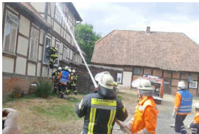
Eine Übung beim Feuerwehrfest 2018.

In Hanstedt gibt es statt eines Schützenfestes das Feuerwehrfest. Die Zeit bleibt nicht stehen und hat auch die Feuerwehren der Gemeinde verändert. Aus zwei Feiern früher ist ein Festwochenende mit viel Aktionen für alle geworden. Die Wehren der Dörfer Allenbostel, Bode und Hanstedt arbeiten in einer Kooperation zusammen. Es ist eine sehr aktive Jugendwehr entstanden und jetzt soll eine Kinderfeuerwehr das Interesse an diesem wichtigen Ehrenamt noch früher wecken.