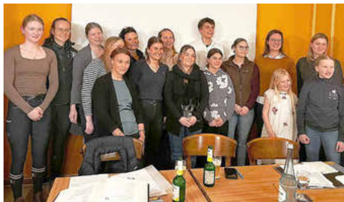
Mitglieder des Reit- und Fahrvereins Ebstorf.

Auch die noch junge Trendsportart Hobbyhorsing wird wieder Teil des Programms sein. Entsprechende Prüfungen sind vorgesehen, und Anmeldungen