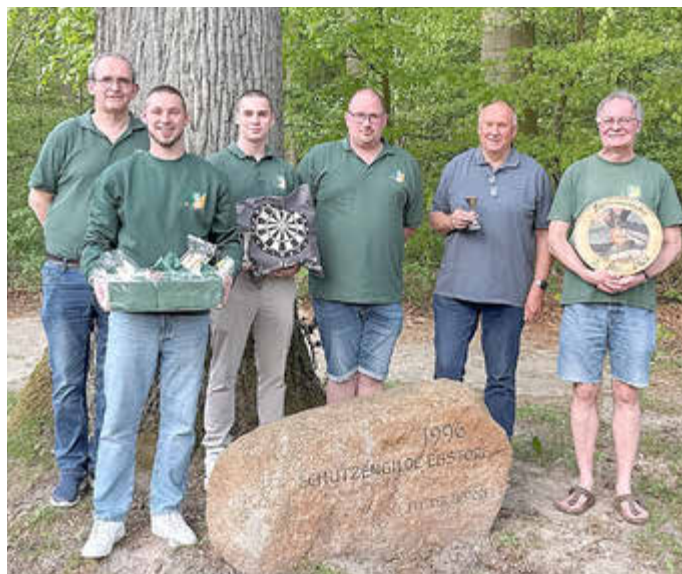
Die glücklichen Sieger vom Joppen-Schoppen.