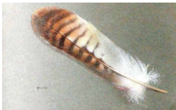
Die Federn sind gezeichnet, jedoch fließt eine malerische Note mit ein.

Anzeigenwerbung | Beilagenverteilung | Drucksachen