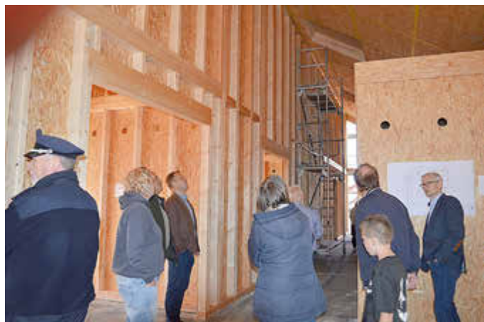
Luftig und hell präsentiert sich der Rohbau. Auch ein Bewegungsraum gehört zur Raumplanung.