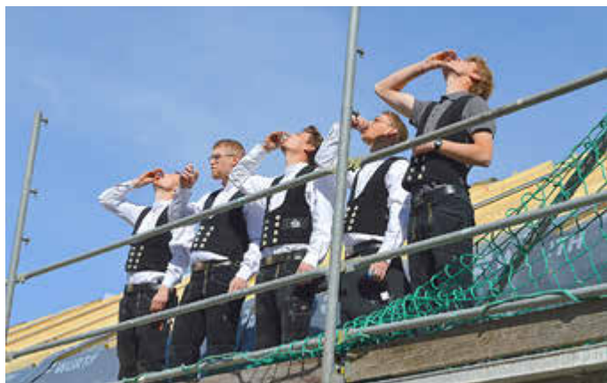
Der Richtspruch wurde hoch oben auf dem Dach vom Zimmermannsteam von Schenk Holzbau begossen. Wenn das kein Glück bringt!