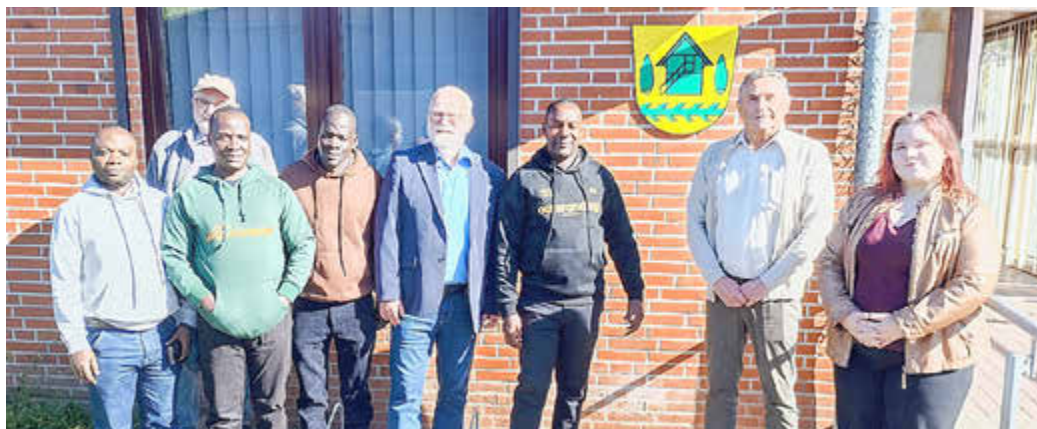
In Wriedel informierten sich Lehrer aus Uganda über das deutsche Schul- und Bildungssystem.