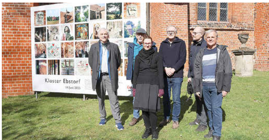
Die Ergebnisse des Workshops „Click im Kloster“ 2025 sind auf einer Foto-Installation vor der Klosterkirche noch bis zum Herbst dieses Jahres zu sehen.

Lina Hatscher, Pressereferentin und stellvertretende Sprecherin der Klosterkammer, hatte den Workshop betreut und dankte