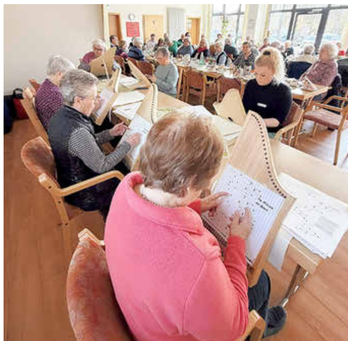
Die Harfengruppe des DRK sorgte für den musikalischen Rahmen der Mitgliederversammlung.

Auch Ausflüge und gemeinsame Aktivitäten stehen weiterhin auf dem Programm: Am 28. Mai ist eine Busfahrt zum Spargelessen an den Hoopter Deich geplant, für die bereits Anmeldungen möglich sind. Im August soll eine weitere Fahrt zum Baumwipfelpfad „Heide-Himmel“ folgen. Zudem erfreuen sich Geburtstagsfeiern und Ehrungen großer Beliebtheit.