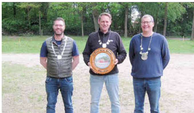
Drei der Gewinner der Gildemeisterschaft.

In Erwartung dieses Votums hatte der Gildevorstand natürlich schon vorher mit den Vorbereitungen begonnen und informierte über den Stand der Dinge, so dass sich alle Ebstorferinnen und Ebstorf auf das diesjährige Schützenfest vom 1. bis 6. Juli freuen können. Gut zu wissen: die Anmeldung der Löffeljungen findet in der 25. Kalenderwoche (15.-21. Juni) statt, per WhatsApp oder te-