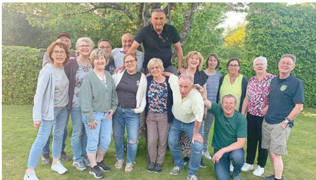
Sie stellen was auf die Beine: das Team Dorfgemeinschaft Wriedel.

Auch für das leibliche Wohl war bestens gesorgt. Neben kühlen Getränken wurden Pommes und Bratwurst angeboten. Gegen Nachmittag ergänzten hausgemachter Kuchen, Waffeln und frischer Kaffee das