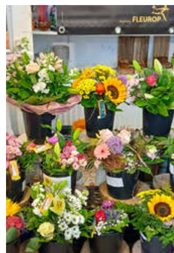
Einige frisch am Morgen gebundene Sträuße sind immer vorrätig für den schnellen Einkauf.

Und wer es nicht schafft, während der Geschäftszeit das Ladengeschäft aufzusuchen, hat die Möglichkeit, sich im Außenverkauf vor