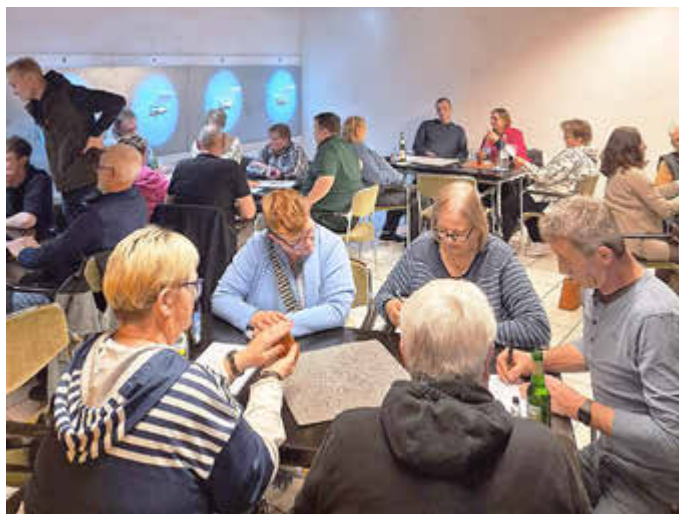
Die gemeinsame Veranstaltung der Freiwilligen Feuerwehr Brockhöfe/Lintzel und der Kyffhäuserkameradschaft Wriedel war sehr gut besucht.

Gut gestärkt folgten zwei weitere spannende Durchgänge,