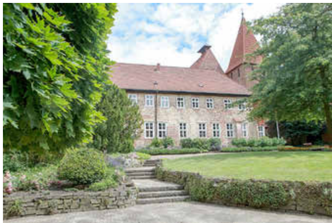
Das Kloster Ebstorf.