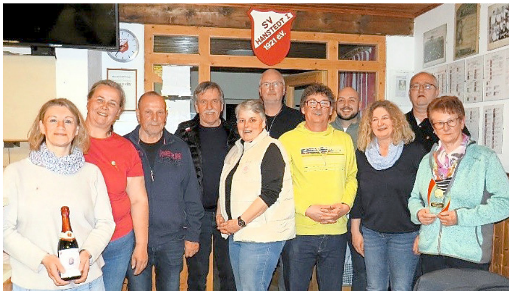
Geehrte beim SV Hanstedt I.