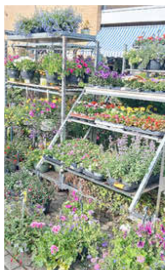
Die Auswahl im Ebstorfer Blumeneck ist immer groß.