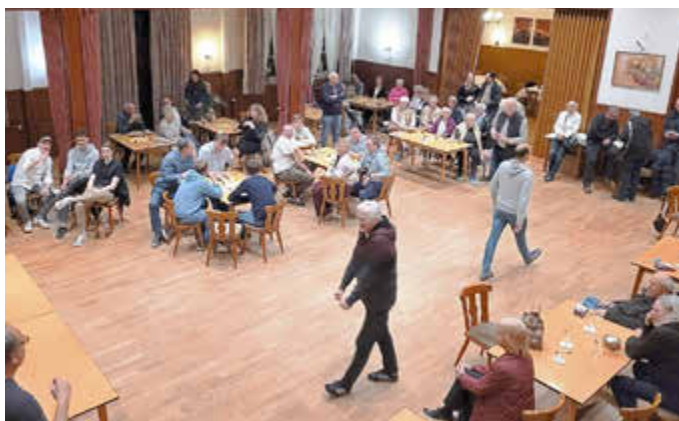
Der Spieleabend war wieder gut besucht.

75 Personen nahmen an diesem Event teil und konnten ihr Können im Denksport unter Beweis stellen. Und natürlich konnte jeder am Ende des Tages nicht nur ein Lächeln, sondern auch noch einen Preis mit nach Hause nehmen.