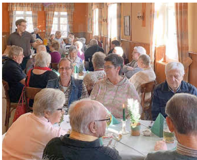
Die Veranstaltung des SoVD war sehr gut besucht.