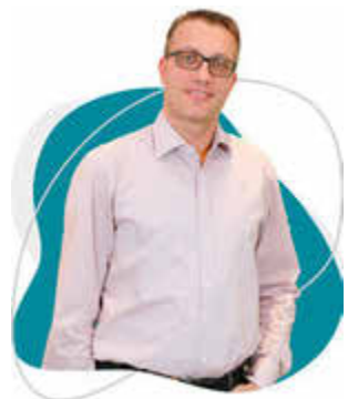
Notdienst: ND = Umland, UE = Stadt Uelzen Angaben vorbehaltlich etwaiger Änderungen

Persönlich erreichen Sie uns bei Fragen zu den Apothekenöffnungszeiten oder an unserem Beratungstelefon: 05822-3941. Aber auch von zu Hause aus können Sie uns 24h am Tag Ihre Fragen stellen im InterNet: www.ebstorfer-apotheke.de . Neben unserem Gesundheitsportal finden Sie hier auch unseren vollständigen Apotheken-Online-Shop. Und folgen Sie uns auch auf Facebook & Instagram – dann verpassen Sie nix: www.facebook.com/ebstorferapotheke