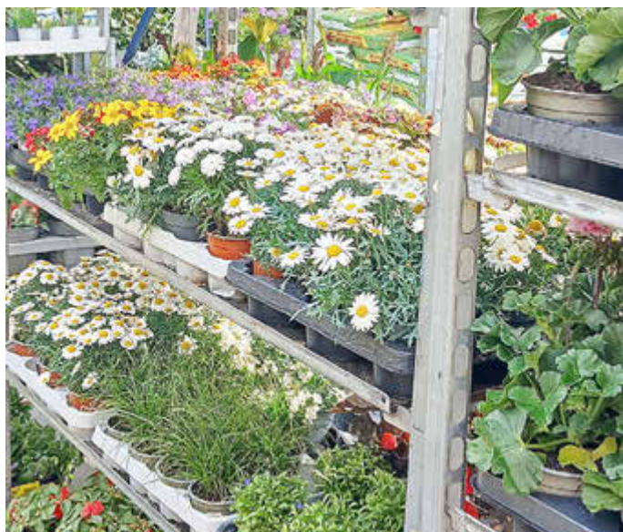
Bunte Vielfalt an getopften Pflanzen.

„Machen Sie auch Eventfloristik?“, fragte neulich eine Kundin. Ja, selbstverständlich. Im Ebstorfer Blumeneck werden auch