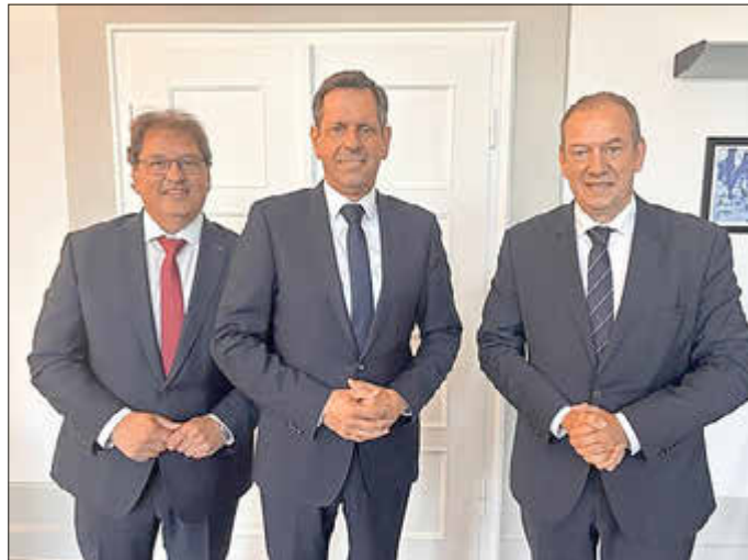
Landrat Axel Flader (von links) beim Treffen mit Ministerpräsident Olaf Lies und dem Wehrbeauftragten Henning Otte.

„Die Bedrohungslagen der Zukunft machen an Kreisgrenzen keinen Halt. Wir brauchen klare Strukturen, verlässliche Ressourcen und einen echten Schulterschluss zwischen Bund, Land und Kommunen – dieses Gespräch war ein wichtiger Schritt in die richtige Richtung. Ich bin dem Ministerpräsidenten dankbar, dass er die Sichtweise der kommunalen Akteure bei diesen Themen in die Überlegungen des Landes einfließen lässt.“