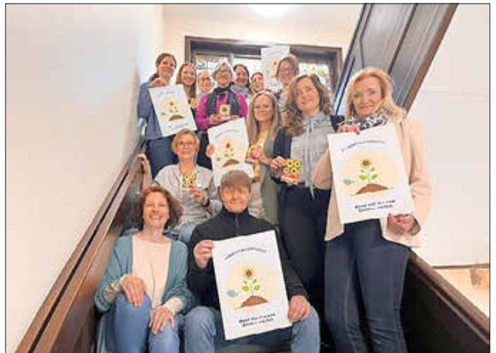
Die Mitarbeiterinnen und Mitarbeiter der Fachberatung Kindertagespflege des Landkreises Celle mit den Postkarten mit einem Dankesgruß und Sonnenblumensamen für die Tagespflegepersonen.