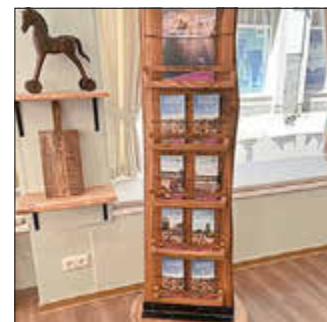
Die neuen Flyer liegen auch in der Tourist-Information am Markt 7 aus.

Erhältlich sind die Flyer in allen Tourist-Informationen im Landkreis Celle – und ab sofort auch in der Tourist-Information Celle am Markt 7.