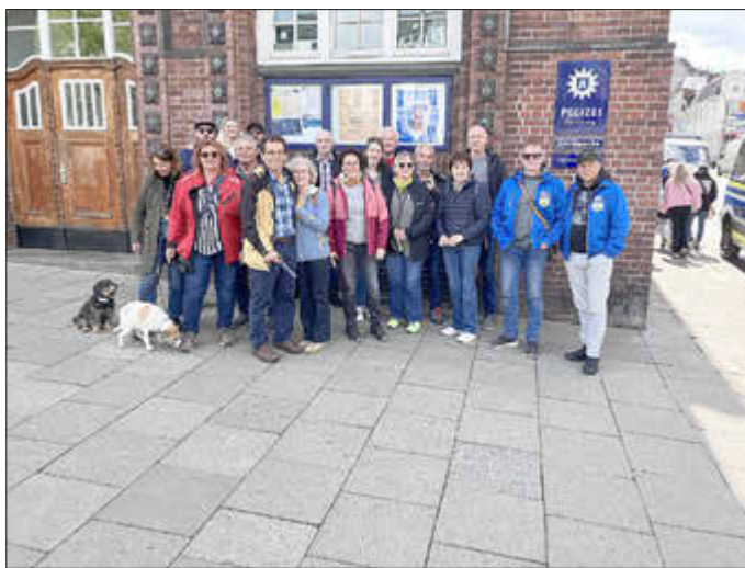
Teilnehmer des Vortreffens

Bergen, 20.05.2025: Am vergangenen Himmelfahrtswochenende gab es einen kleinen Vorgeschmack auf das 2027 stattfindende 16. nationale Bergen-Treffen. Abordnungen aus Ortschaften mit dem Namen „Bergen“ aus der gesamten Bundesrepublik kamen zu Besuch, um das im kommenden Jahr stattfindende Bergen-Treffen zu planen. Neben einem regen Erfahrungsaustausch besuchten die Teilnehmer das Museum Römstedthaus sowie die Städte Hamburg und Celle.