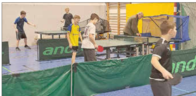
Volle Halle beim Jugendtraining

Die TT-Jugendabteilung im TuS Ehra-Lessien umfasst momentan 45 Mädchen und Jungen ab 8 Jahren, die immer dienstags und freitags ihre Schläger schwingen. Jetzt ist erst einmal Pause, denn die Sommerferien stehen vor der Tür.