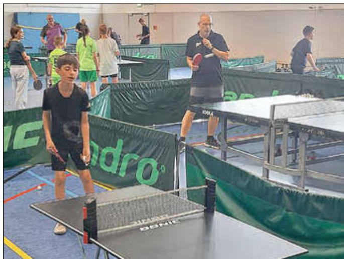
TT, ein schöner Sport für alle, die sich bewegen wollen

Tischtennis als Rückschlagsportart ist extrem gut für den Körper und gilt als eine der gesündesten Sportarten. Es bietet ein effektives Ganzkörpertraining, das Herz-Kreislauf-System, Koordination, Reflexe und Muskeln (besonders Beine, Rumpf, Arme) stärkt, ohne die Gelenke übermäßig zu belasten. Zudem fördert es die Konzentration und hält das Gehirn fit.