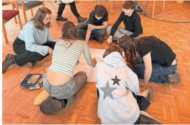
Jugendrat bei der kreativen Arbeit