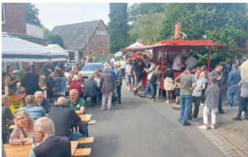
Für Getränke ist gesorgt...

Die örtlichen Vereine und Organisatoren freuen sich auf viele Besucherinnen und Besucher!