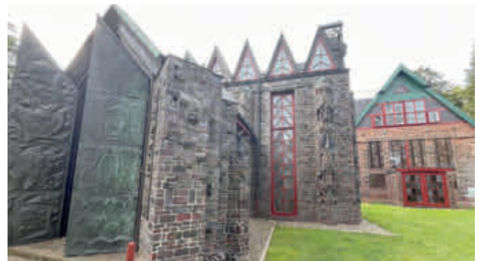
Museum Kunststätte Bossard – Der Kunsttempel im Mittelpunkt des historischen Gebäudeensembles

Karten für die Veranstaltungen sind ab sofort an der Museumskasse erhältlich. Weitere Infos unter 04183/5112 oder info@bossard.de .