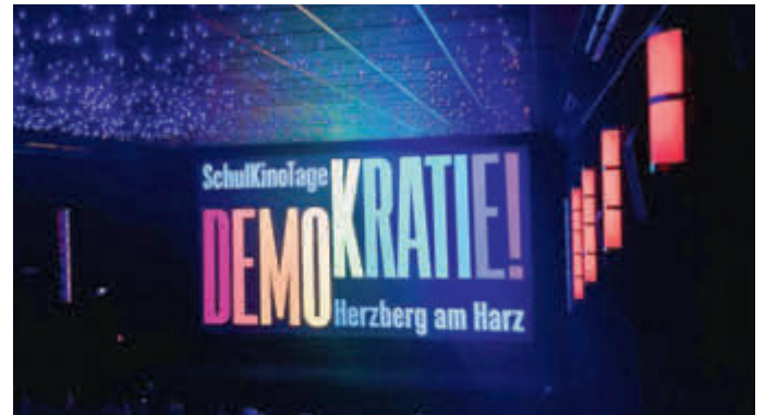
Veranstaltung in Herzberg am Harz

Kultur und Medien, der Filmförderungsanstalt, der Stiftung Deutsche Kinemathek sowie der Kino macht Schule GbR, bestehend aus AllScreens – Verband Filmverleih und Audiovisuelle Medien e.V., dem HDF Kino e.V., der Arbeitsgemeinschaft Kino • Gilde deutscher Filmkunsttheater e.V. und dem Bundesverband kommunale Filmarbeit e.V. Die Schirmherrschaft über VISION KINO hat Bundespräsident Frank-Walter Steinmeier übernommen.