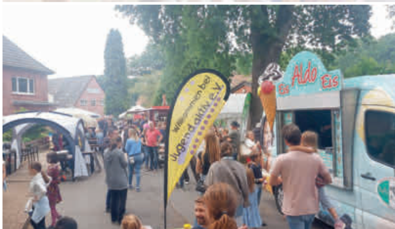
Köstliche Leckereien warten auf die Gäste!