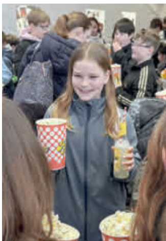
Die SchulKinoWochen Niedersachsen wurden in diesem Jahr von mehr als 82.000 Schüler:innen und Lehrkräften besucht.

Mit den SchulKinoTagen DEMOKRATIE! wird das gemeinsam mit regionalen Kooperationspartnern entwickelte Bildungsformat der „Filmprojekttag zur demokratischen Grundversorgung“ fortgeführt, das 2024 erfolgreich gestartet und 2025 weiter ausgebaut wurde.