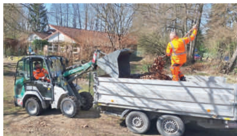
Der Bauhof in Aktion

Bei besonderen Wetterlagen – wie Sturm oder Schnee – ist der Bauhof schnell im Einsatz,