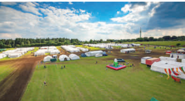
Kreiszeltlager - so sieht die Zeltstadt aus!

Wir freuen uns auf eine abwechslungsreiche und spannende Woche!