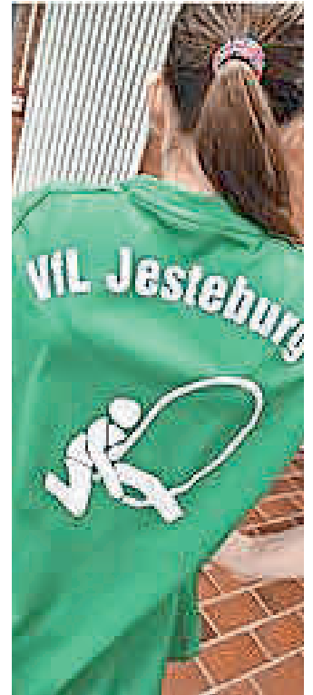
Der VfL Jesteburg auch für die Jugend ein wichtiger Anlaufpunkt