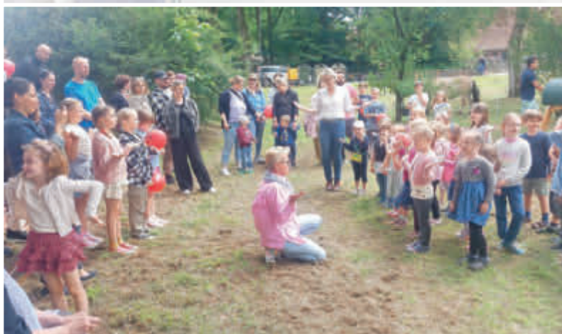
Ein vielfältiges Programm für die Kleinen....