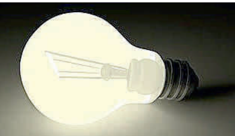
Leuchtmittel für die Grundschule in Jesteburg

Die Verwaltung bedankt sich bei der Firma Rossmann für die Bereitschaft, eine Spende in solcher Höhe zur Verfügung zu stellen und wird den Kontakt zu dem Unternehmen weiterhin aufrechterhalten, um die Entwicklung im Zuge geänderter Rahmenbedingungen zu gegebener Zeit erneut in die Gremien einzubringen.