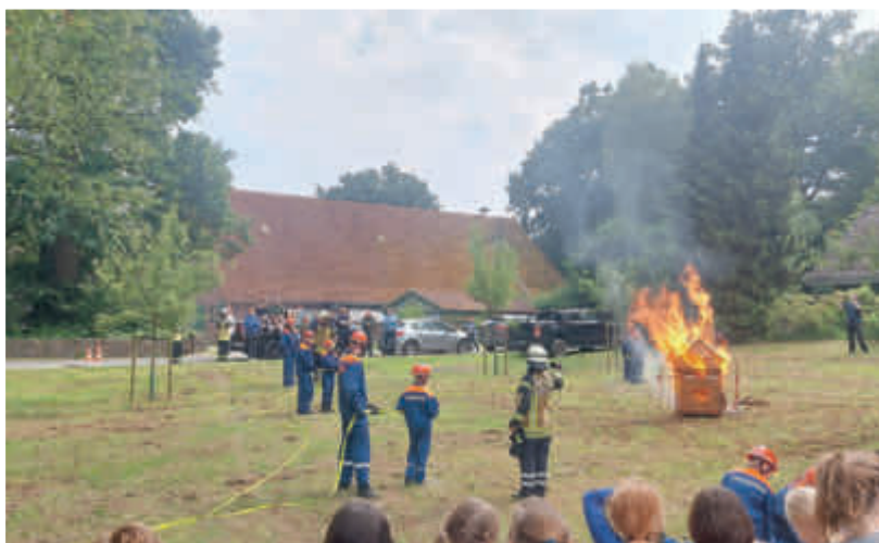
Vorführungen der Feuerwehr