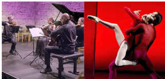
Festivalensemble camerata freden und das Hamburger Kammerballett

Festivalbüro Freden Am Schillerplatz 2, 31084 Freden (Leine) Telefon: 05184 95 01 79 Öffnungszeiten: Mo 14:30–16:30 Uhr, Mi & Fr 9–11 Uhr Tickets auch an allen Reservix-Vorverkaufsstellen und online unter www.fredener-musiktage.de erhältlich.