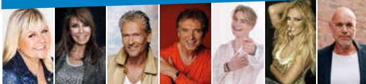
Gaby Baginsky, Ireen Sheer, Olaf Berger, Peter Orloff, Vincent Gross, Loona und Olaf Henning