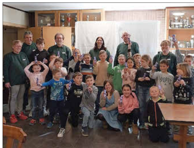
Gruppenfoto der Teilnehmer