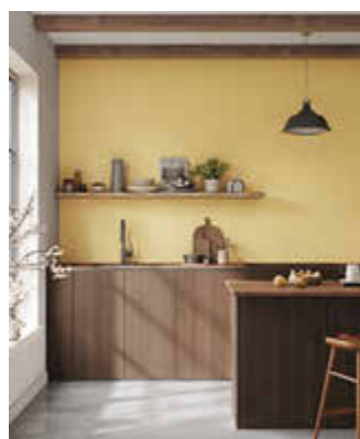
Wer farbliche Akzente setzen möchte, kann Frischeweiß mit Kalkbuntfarben abtönen.

Frischeweiß kommt ohne Lösemittel, ohne Emissionen und ohne synthetische Kunststoffe aus – ein Vorteil für alle, die Wert auf ein gesundes Wohnumfeld legen. Die sehr ergiebige Farbe lässt sich rollen oder streichen; zehn Liter reichen für bis zu 100 Quadratmeter Fläche. Wer farbliche Akzente setzen möchte, kann Frischeweiß mit Auro Kalkbuntfarben abtönen.