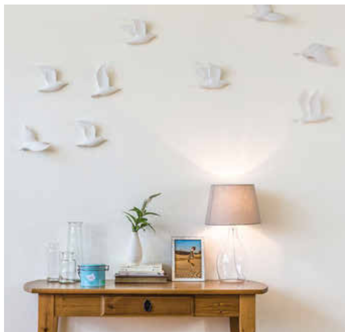
Die sehr ergiebige Farbe lässt sich rollen oder streichen.

Diese Wandfarbe reinigt die Luft mit Licht