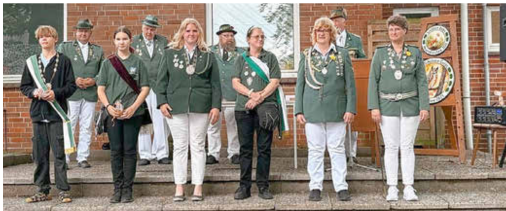
Für den Hof 2025 geht das Regierungsjahr zu Ende.

Das Schützen-Corps Neuenkirchen lädt vom 26. bis 28. Juni 2026 zum traditionellen Schützenfest an der Frielinger Straße 20a ein. Besucherinnen und Besucher erwartet ein abwechslungsreiches Programm für die ganze Familie.