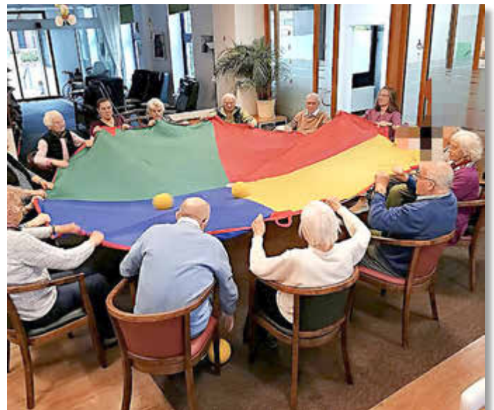
Mit viel Freude und Geschick beteiligten sich die Gäste der „Großen Eiche“. an den Spielen mit Schwungtuch