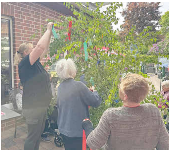
Mit bunten Bändern und guter Laune entstand im Eichenhof ein festlich geschmückter Maibaum.

Mit großer Freude und viel Kreativität wurde im Eichenhof gemeinsam der Maibaum geschmückt.