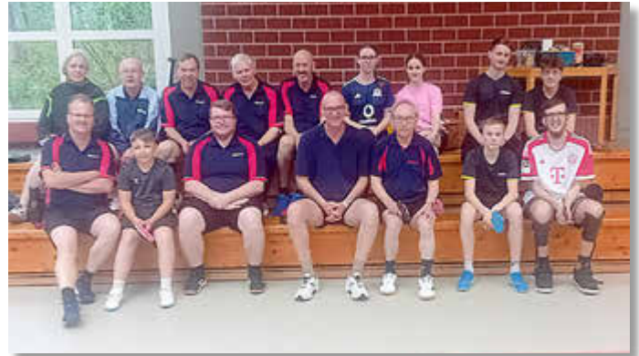
Die Teilnehmer des Moppel-Doppel 2026 des TTC Brochdorfs