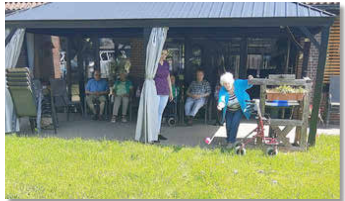
Die Senioren der Großen Eiche genossen eine fröhliche Boccia-Runde im sommerlichen Garten.

Die Senioren der „Großen Eiche“ nutzten die sommerlichen Temperaturen, um gemeinsam einen gemütlichen Nachmittag im Garten zu verbringen.