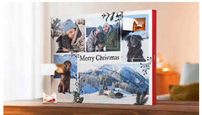
Der Foto-Adventskalender überrascht mit Herz und viel Schokolade.