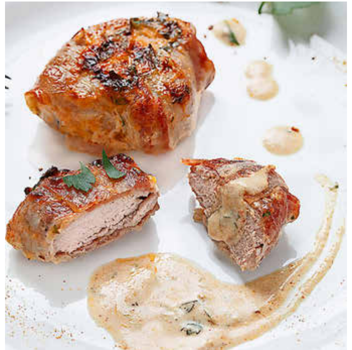
Schweinefilet im Speckmantel ist das richtige Soul-Food für die kalte Jahreszeit.

In einer Schüssel Sahne, Crème fraîche, Tomatenmark, Currypulver, Zucker, Salz und Pfeffer oder Cayennepfeffer mit einem Schneebesen glatt rühren. Petersilie waschen, kleinschneiden und dazugeben. Die Curry-Sahne-Mischung über die Medaillons gießen und die