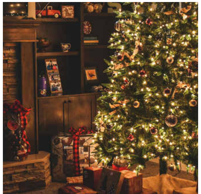
Ihr Team der LINUS WITTICH Medien KG