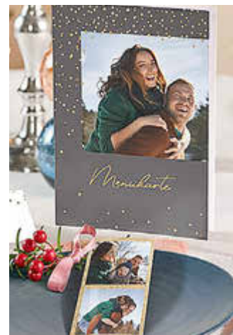
Auch die weihnachtliche Tischdekoration erhält mit eigenen Fotos eine unverwechselbare Note.

Mit wenigen Materialien und einer Prise Kreativität lässt sich eine stilvolle Weihnachtsdekoration gestalten, die schöne Erlebnisse in den Mittelpunkt rückt: