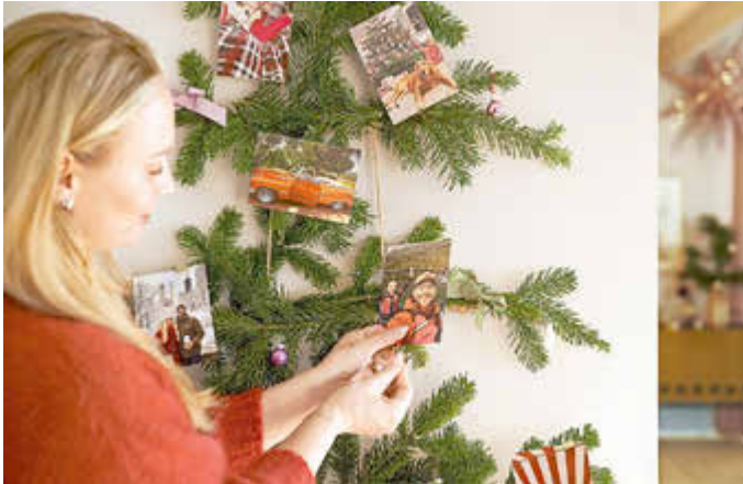
Das Dekorieren der eigenen vier Wände mit persönlichen Lieblingsfotos weckt Vorfreude auf Weihnachten.

terliche Motive schön zur Geltung kommen. Ein oder zwei beim Waldspaziergang gesammelte Äste bilden die Basis. Die runden Anhänger aus Acrylglas lassen sich mit persönlichen Bildern gestalten und können mit dem beiliegenden Band einfach am Ast befestigt werden. Kombiniert mit kleinen Kugeln, Tannenzweigen oder Glöckchen entsteht im Nu ein Hingucker.