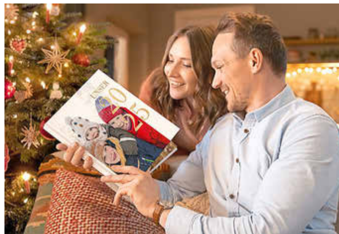
Erinnerungen verschenken: Ein selbstgestaltetes Fotobuch bringt schöne Momente zurück.

Ob beim Gang in die Küche oder dem Blick auf den Schreibtisch: Fotomagnete mit eigenen, winterlichen Bildern bescheren den