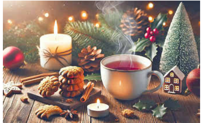
Adventsmomente bewusst genießen – Tee und Plätzchen bringen Ruhe in den Alltag.