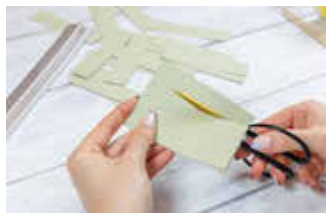
Das Tonpapier längs halbieren und jede Hälfte in 12 etwa 2,5 cm breite Streifen schneiden.