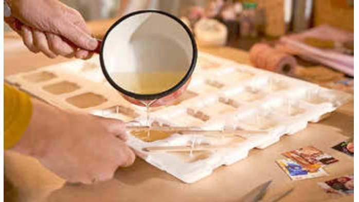
Mit wenigen Handgriffen verwandelt sich der Adventskalender in einen Kerzen-Vorrat fürs Wachs gießen an Silvester.

schnitten und jeweils mit Fotos – zum Beispiel mit den Türchenmotiven des Adventskalenders – dekoriert. Am Silvesterabend werden die kleinen Kerzen aus der Umhüllung genommen, auf einem Löffel angezündet, eingeschmolzen und in kaltes Wasser gegossen. Das geformte Stück kann dann gedeutet werden.