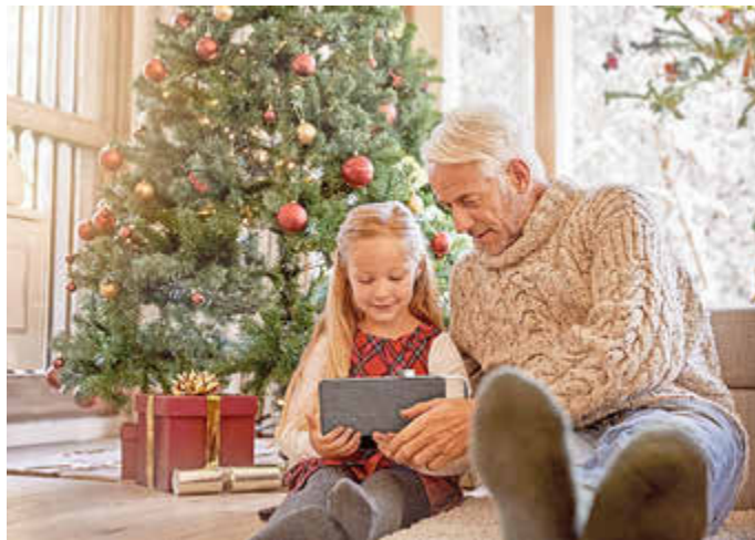
Mit etwas Rücksichtnahme und Verständnis füreinander verläuft Weihnachten harmonisch.