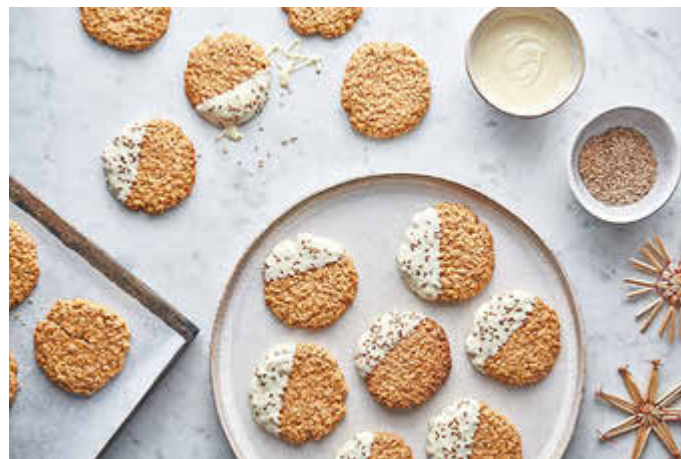
Haferflocken verleihen Weihnachtsgebäck einen gesunden Touch - wie hier den schwedischen Keksen mit Kardamom.

Beim vorweihnachtlichen Backen kann Hafer vielfältig eingesetzt werden. So lässt sich im Lieblingsrezept einfach bis zu einem Drittel der angegebenen Mehlmenge durch Haferflocken ersetzen. Oder man kann die angegebene Nussmenge damit austauschen oder ergänzen, denn Haferflocken schmecken angenehm nussig.