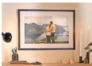
Wandbilder mit persönlichen Lieblingssmotiven unterstreichen die stimmungsvolle Atmosphäre.