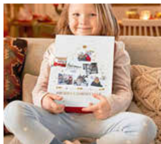
Alle Jahre wieder sorgt ein Adventskalender für strahlende Kinderaugen.

Wer seinen Adventskalender selbst befüllen möchte, findet