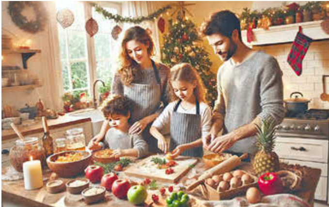
Gemeinsame Vorbereitung: Kochen im Team macht Spaß und entlastet alle Beteiligten.