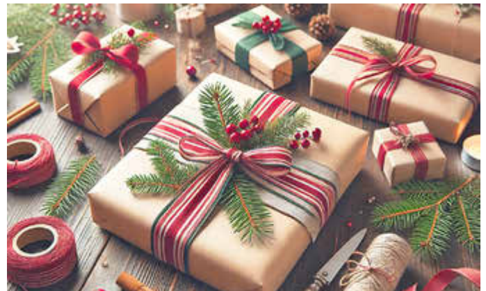
Geschenke frühzeitig kaufen, um die hektische Suche in letzter Minute zu vermeiden.

(DJD). Weihnachten bringt oft eine Mischung aus Vorfreude und Stress mit sich. Geschenke besorgen, die Wohnung schmücken und das Festtagsessen planen – all das kann schnell überwältigen. Eine gute Planung kann jedoch helfen, Stress zu vermeiden und die Adventszeit entspannt zu genießen. Hier sind sieben praktische Tipps: