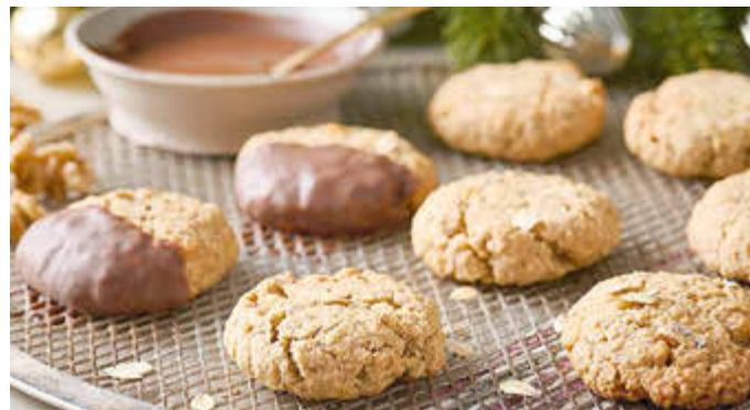
In Haferflocken-Walnuss-Keksen ergänzt sich der leicht nussige Geschmack von Haferflocken mit dem Geschmack der Walnüsse perfekt.