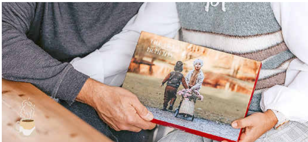
Vorfreude verschenken: Ein Adventskalender mit einem Foto der Enkel beschert den Großeltern 24 Glücksmomente.

Ob ein niedliches Kinderfoto, ein Schnappschuss mit dem Haustier oder ein lustiger Moment mit der besten Freundin – mit dem Lieblingsbild gestaltet und gefüllt mit feiner Schokolade und Naschereien von bekannten Marken wird der Adventskalender zu einem ganz besonderen Blickfang. Bei vielen Adventskalendern etwa von CEWE bieten neben der großflächigen Vorderseite auch die Innenseiten Platz für 24 Fotoüberraschungen – für doppelte Freude hinter jedem Türchen. Eine stilvolle Dekoration stellt auch ein Tisch-Adventskalender dar.