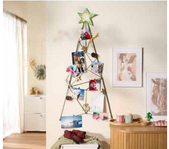
Ein DIY-Weihnachtsbaum mit besonderen Schnappschüssen sorgt für festliche Stimmung im Zuhause.