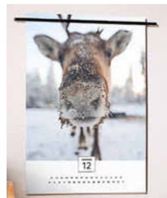
Zwölfmal Freude verschenken: Ein Wandkalender mit eigenen Fotos begleitet die beschenkte Person durch das neue Jahr.

Für Freude im Alltag sorgt auch die neue Lieblingstasse mit einem hübschen Foto. Als Präsent lässt sich die Tasse zudem mit kleinen Aufmerksamkeiten liebevoll füllen und dekorieren. Passende Kleinigkeiten sind schnell gefunden: Wie wäre es