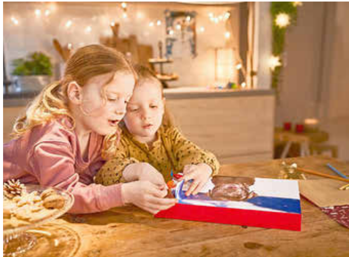
Vorfrende auf Weihnachten: Ein kreativ gestalteter Adventskalender verkürzt die Wartezeit bis zum Fest.