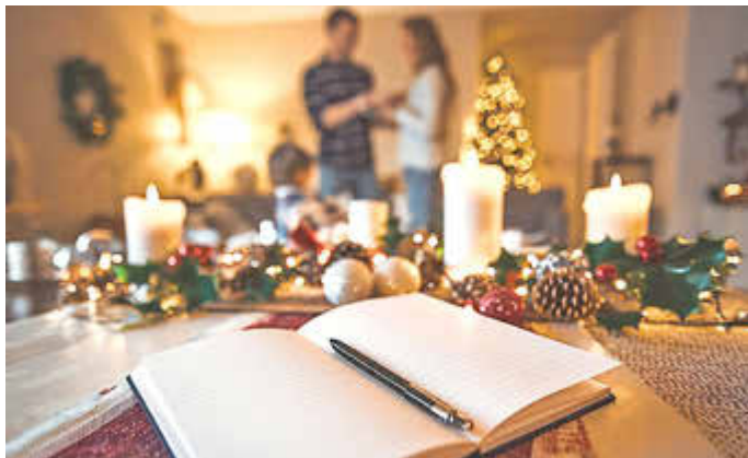
Eine To-do-Liste hilft, den Überblick zu behalten und reduziert Stress in der Vorweihnachtszeit.