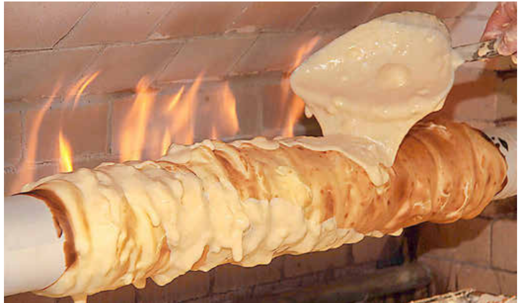
Eine Walze dreht sich langsam und regelmäßig vor einer offenen Flamme. Die Baumkuchenmasse wird in einer ersten dünnen Lage auf die Walze aufgetragen, dann folgt Schicht um Schicht.

Die Zutaten für den Salzwedeler Baumkuchen sind immer Butter, Zucker, Mehl und Eier. Eine Walze dreht sich langsam und regelmäßig vor einer offenen Flamme.