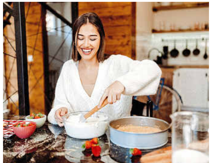
Selbstgemacht schmeckt einfach besser: Für Frischkäse braucht man nur zwei Zutaten, Milch und Lab.

Weizenmehl, Labessenz und 1/4 Liter Milch gut mischen. Die restliche Milch auf 40 °C erwärmen und von der Kochplatte nehmen. Die Mehl-Milch-Lab-Mischung in die warme Milch rühren. Nach 2-3 Stunden die Käsemasse von der Molke trennen (alles vorsichtig in ein feinsmaschiges Sieb schütten). Die Mandeln abbrühen und fein mahlen. Erst die Sahne steif schlagen und dann die Eier mit dem Zucker gut verrühren. Die Käsemasse mit Eierzucker-Mischung, Sahne und Mandeln zusammenrühren und in eine gefettete ofenfeste Glas- oder Keramikform umfüllen (ca. 20x30 cm). Den Käsekuchen im Wasserbad bei 175 °C ca. 50 Minuten backen, bis der Kuchen eine goldbraune Farbe bekommen hat. Er schmeckt am besten noch lauwarm oder bei Zimmertemperatur. Dazu passen Schlagsahne und eine Beerenmarmelade.