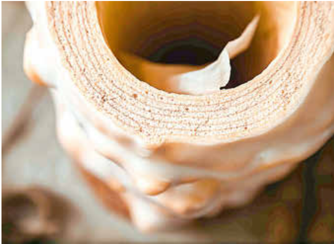
Die typischen Ringe machen jeden in Handarbeit hergestellten Baumkuchen zu einem leckeren Unikat.