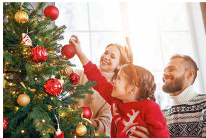
Sicher stehen sollte der Christbaum, damit man ihn mit allerlei festlicher Dekoration zum Funkeln bringen kann.

Um den Baum schnell und sicher aufzustellen, sollte er einen ge-