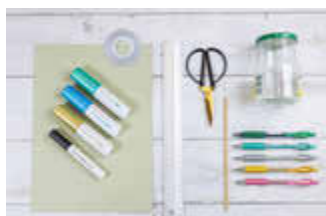
Das Material für den Achtsamkeits-Adventskalender ist überschaubar.