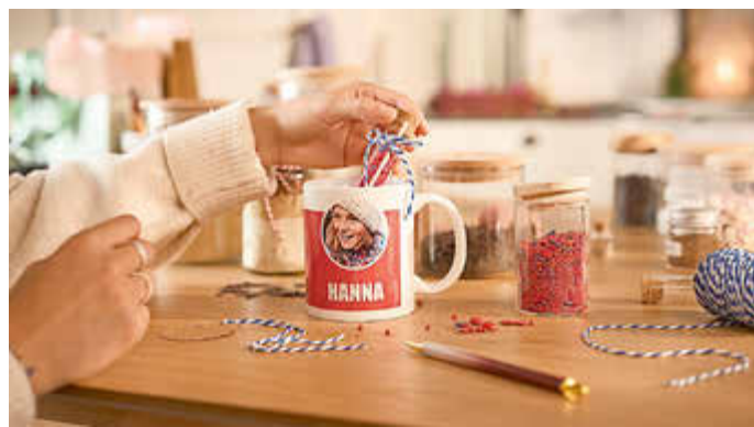
Die neue Lieblingstasse lässt sich individuell mit kleinen Aufmerksamkeiten befüllen.

Die Erinnerungen an die schönsten Momente des Jahres lassen sich auch in einem Wandkalender auf kreative Weise festhalten und verschenken. Ob Fotos von der Geburtstagsfeier, dem Wanderurlaub oder aus dem eigenen Garten – mit einem selbstgestal-