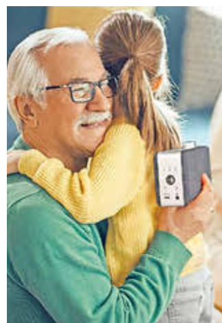
Ein Fest für jede Generation: Zu Weihnachten kommen Jung und Alt zusammen.

Nienburger Str. 6 · 29323 Wietze · Tel.: 05146/8558 Kanonenstr. 7 · 29308 Winsen · Tel.: 05143/6666250