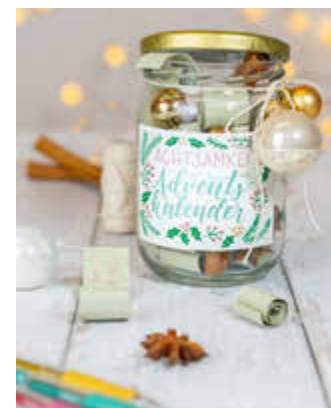
Ein Achtsamkeits-Adventskalender verspricht Entschleunigung und Gelassenheit.

3. Füllen und verschenken: Alle 24 Papierrollen in das Glas legen, Deckel schließen und mit etwas Schnur und dekorativen Elementen verzieren. So entsteht im Handumdrehen ein individueller Adventskalender, der sich auch wunderbar verschenken lässt.