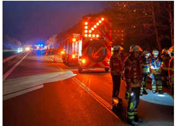
Im Rahmen einer baustellenbedingten nächtlichen Sperrung der Autobahn konnte der Anhänger erstmals unter realistischen Bedingungen beübt werden.

gut sichtbare Absicherung für den nachfolgenden Verkehr. Insbesondere bei schlechten Sichtverhältnissen oder hohem Verkehrsaufkommen stellt dies einen wichtigen Beitrag zur Verkehrssicherheit dar. Einsätze im Straßenverkehr sind für Feuerwehrkräfte mit erhöhten Risiken verbunden. Vorbeifahrende Fahrzeuge, hohe Geschwindigkeiten und unübersichtliche Situationen können schnell zur Gefahr werden.