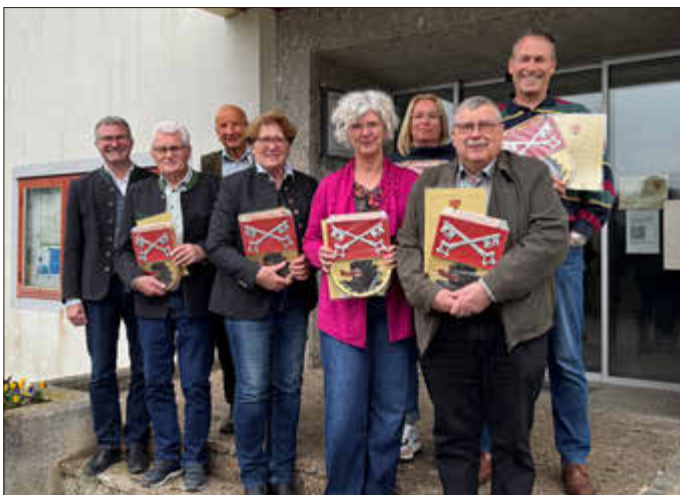
Die ausscheidenden Mitglieder des Gemeinderats.

Doch auch der bisherige Rat, auf dessen Arbeit Bürgermeister Wagner nun aufbaut, ist zu würdigen. Er kündigte deshalb auch seinerseits eine gebührende Ehrung zu einem späteren Zeitpunkt an.