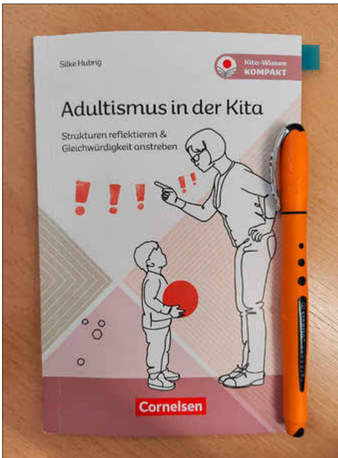
Fachliteratur von Silke Hubrig