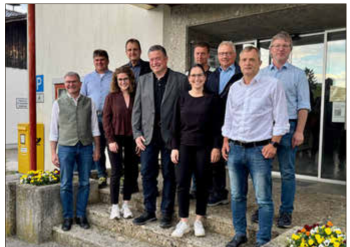
Die neuen Mitglieder des Gemeinderats.