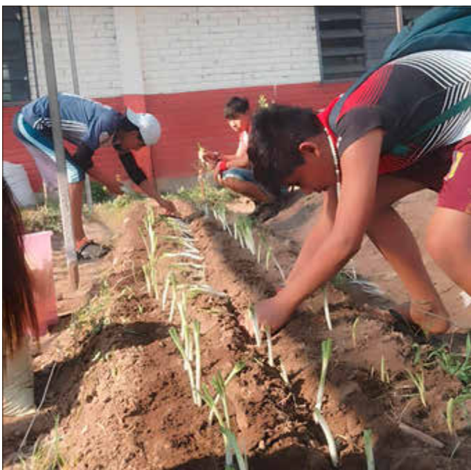
Heimbewohner pflanzen gemeinsam im Garten