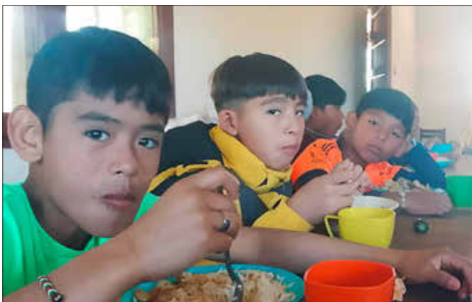
Regelmäßige Mahlzeiten für früher vernachlässigte Kinder und Jugendliche