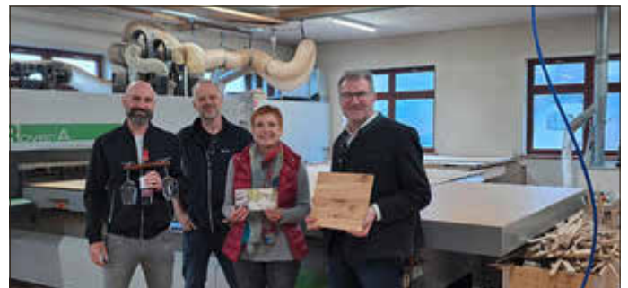
Gewinnübergabe in der Schreinerei Braun