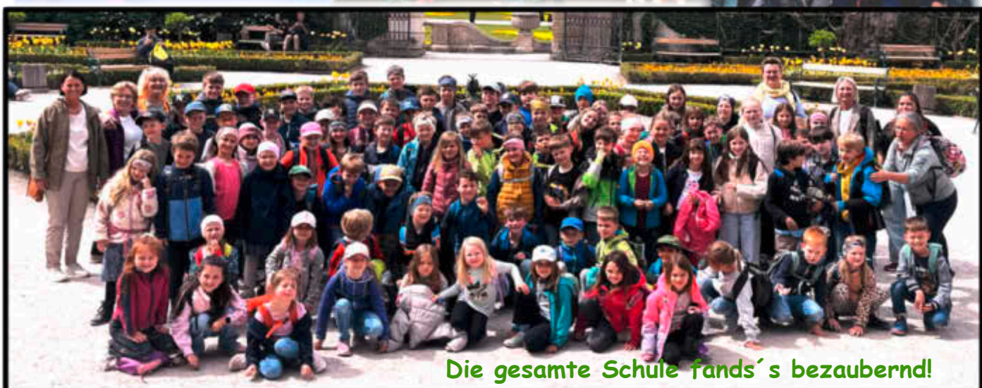
Die gesamte Schule fands' s bezaubernd!