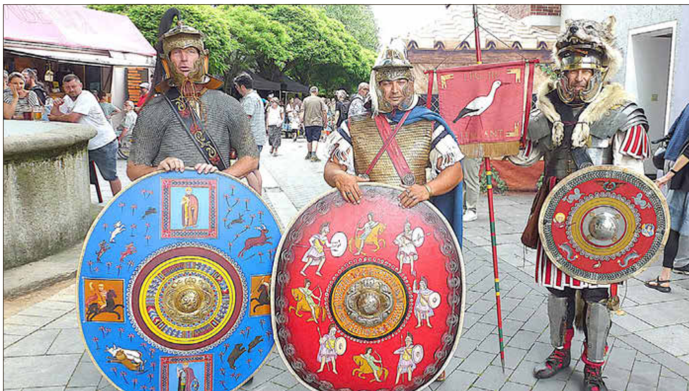
Bewaffnet und mit Schutzschilden zogen Soldaten durch die Innenstadt