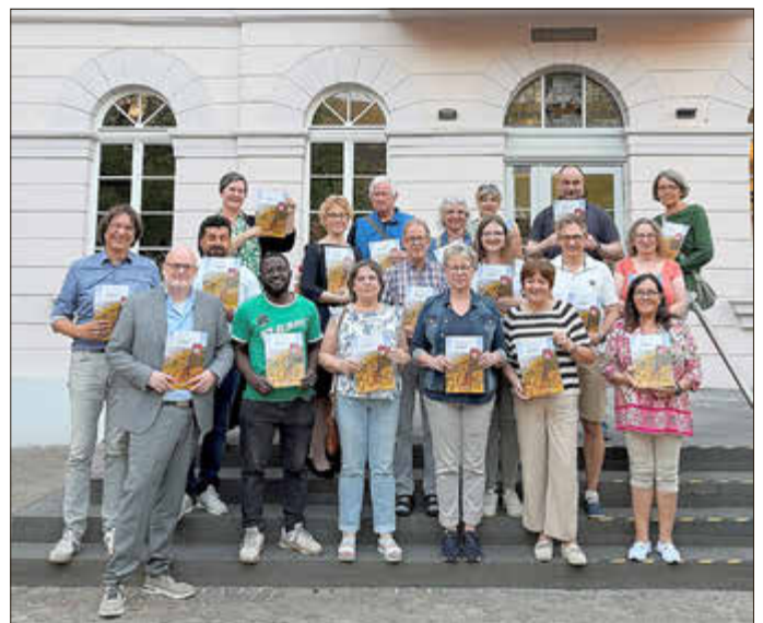
Die Teilnehmenden vor dem Remagener Rathaus

Vor kurzem trafen sich örtliche Einzelhändler*innen, Gastronom*innen und Gastgeber*innen auf Einladung des Remagener Stadtmarketings mit dem Ahrtal-Tourismus. Seit Anfang des Jahres wird die Stadt Remagen nicht nur über den Mittelrhein, sondern auch über das Ahrtal touristisch vermarktet.