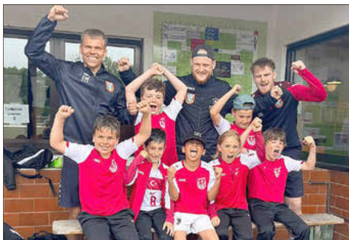
Die F1-Junioren waren zu Gast beim FUNino-Turnier in Niederzissen.

Auch in den nächsten Tagen stehen für die Nachwuchsteams des SV Kripp weitere Spiele und Termine auf dem Programm. Die Saison biegt zwar langsam auf die Zielgerade ein, dennoch möchten die Mannschaften die verbleibenden Aufgaben nutzen, um weitere positive Ergebnisse und Entwicklungen mitzunehmen.