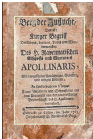
Titelseite von 1763