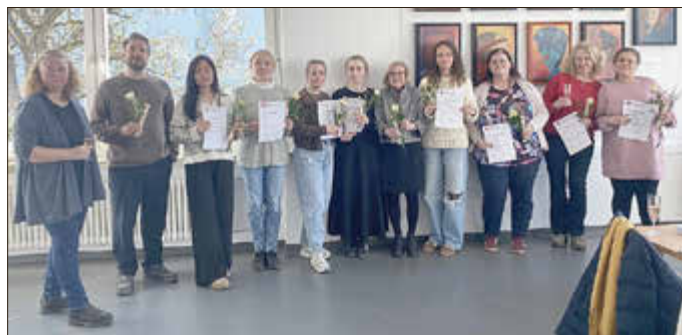
Neun Fachkräfte aus Kindertagesstätten der Stadt Remagen absolvierten erfolgreich ihre Weiterbildung zur alltagsintegrierten Sprachförderkraft.