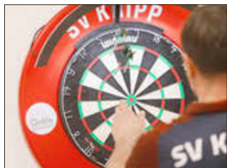
Der SV Kripp lädt am 27. Juni zum Steeldarts-Turnier ein.

KRIPP. Der SV Kripp veranstaltet am Samstag, 27. Juni, erstmals den Rhein-Ahr-Cup, ein offenes Steeldarts-Turnier für Spielerinnen und Spieler aus der gesamten Region. Austragungsort ist die Gymnastikhalle im Sportpark „Am Querweg“ in Remagen-Kripp. Das Einwerfen beginnt um 14:00 Uhr, der offizielle Turnierstart ist um 14:30 Uhr. Gespielt wird im Modus 501 Double Out. Nach einer Gruppenphase folgt die K.-o.-Runde, in der die besten