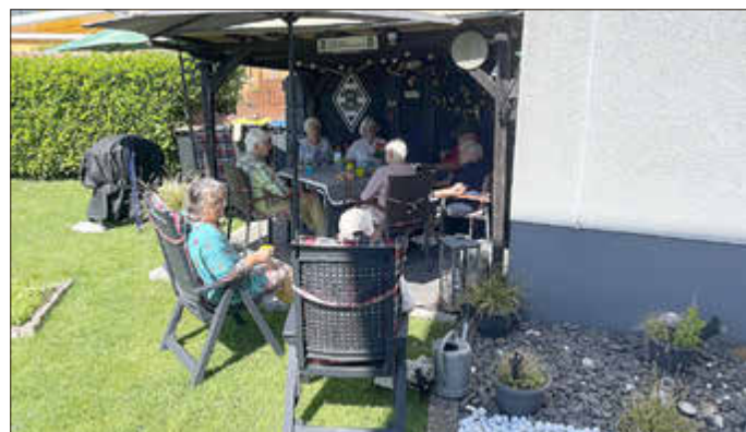
„Gemütlichkeit kennt keine Grenzen...“ Mit dabei Wasser & nette Gespräche.