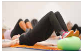
Zwei neue Reha-Sport-Kurse bietet der SV Kripp ab Juni an.