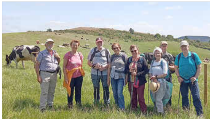
Bei Fronrath vor einer Rinderkoppel

Die fast 15 km lange Tour startete von Niederheckenbach am Forsthaus Tannenberg und ging mit einem einsamen Aufstieg auf die Höhen von Fronrath. Viel Grünland mit Rinderherden wurde bestaunt. Die Landschaft war idyllisch und man fühlte sich in einer anderen Welt. Eine längere Passage durch Waldgebiete führte bis in die Nähe des Schöneberges mit seinen Antennentürmen. Weiter zu dem Ort Cassel, wo auf den umliegenden Wiesen viele Pferde weideten. Auffällig waren noch die großen Flächen mit Heidelbeerpflanzen. Nun ging es nur noch bergab zum Parkplatz in Niederheckenbach. Im Abschlussgespräch war dann die Begeisterung für diese vorgefundene Einsamkeit mit den tollen Panoramen noch einmal gegenwärtig.