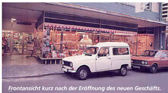
Frontansicht kurz nach der Eröffnung des neuen Geschäfts.

seiner Ausbildung und mehreren Jahren Berufserfahrung im Lebensmittelhandel kehrte er nach Sinzig zurück und arbeitete fortan im Familienbetrieb mit. 1997