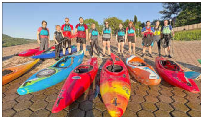
Die Teilnehmerinnen und Teilnehmer des EPP-Kurses