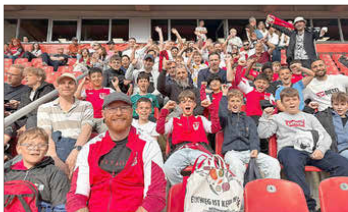
Die E1- und D-Junioren des SV Kripp waren zu Gast in der Leverkusener BayArena.

KRIPP. Bereits Anfang Mai stand für die E1- und D-Junioren des SV Kripp ein ganz besonderes Highlight auf dem Programm: Gemeinsam machten sich die Nachwuchskicker samt Trainerteams auf den Weg in die Leverkusener BayArena, um am 32. Spieltag der Fußball-Bundesliga das Heimspiel von Bayer 04 Leverkusen gegen RB Leipzig live zu verfolgen.