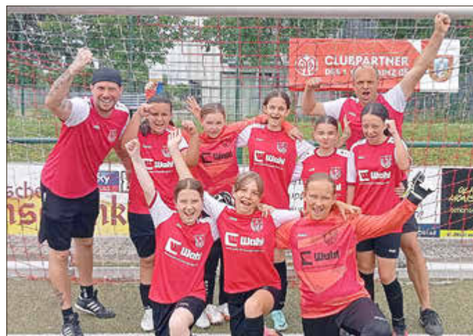
Die Spielerinnen des SV Kripp feierten einen 2:1-Heimsieg gegen die JSG Sohren II.

Zum Einsatz kamen: Katherina, Luana, Sumeja, Maila, Inas, Anoa, Elda, Skadi