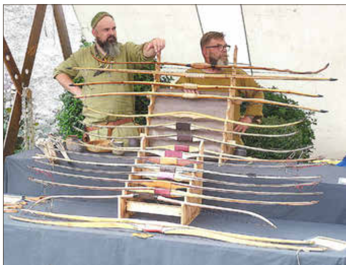
Den Handwerkern, hier Bogenbauer, konnte man über die Schulter schauen

Natürlich war auch für das leibliche Wohl bestens gesorgt, entweder an verschiedenen Ständen oder bei der örtlichen Gastronomie. Eine Veranstaltung, die viele auch aus der Umgebung angelockt hat. Wäre sicher eine weitere Wiederholung wert.