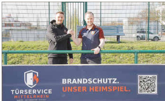
Türservice Mittelrhein GmbH ist neuer Partner des SV Kripp.

Der SV Kripp bedankt sich herzlich für die Unterstützung und freut sich auf eine vertrauensvolle Zusammenarbeit. Gemeinsam möchte man die Zukunft des Vereins gestalten und das Angebot für die Mitglieder nachhaltig stärken.