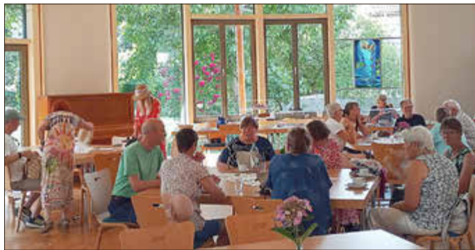
Das schöne Ambiente der „Grünen Oase“ im evangelischen Gemeindehaus

Erstmalig ist zum Lebenskunstmarkt auch die Friedenskirche geöffnet. „10 Minuten Zeit für Gott“: Innehalten, beten, einen Gedanken mitnehmen. Kommen Sie dazu am Sonntag, dem 21.06. um 14:00 Uhr in die Friedenskirche. Im Anschluss sind die Tore der Kirche in unserer „Grünen Oase“ bis ca. 17:00 Uhr geöffnet. Setzen Sie sich an diesem Nachmittag einfach in die Kirchenbank oder lesen Sie von 12 mutigen Menschen, die sich für den Frieden einsetzen. Die Ausstellung „Gesichter des Friedens“ inspiriert dazu, sich über den eigenen Beitrag zu einer friedlicheren Welt nachzudenken.