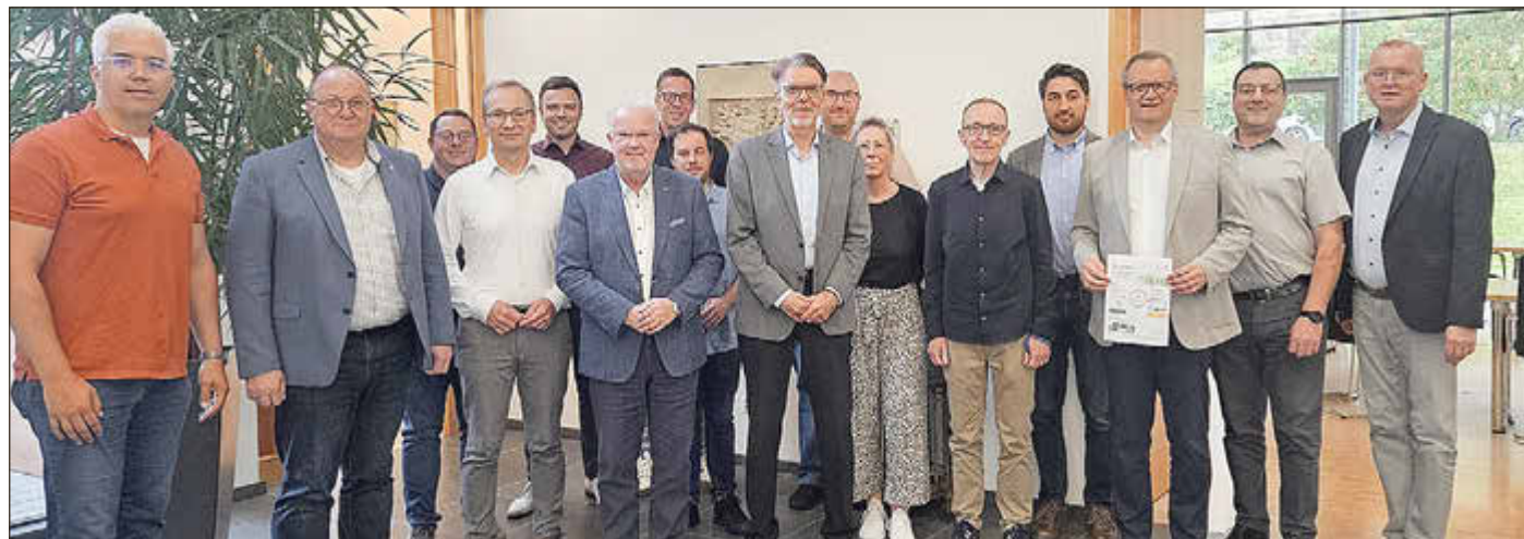
Vertreter der Kommunen des Kreises Ahrweiler, der inframeta eG sowie weiterer Fachinstitutionen kamen im Rathaus der Gemeinde Grafenschaft zusammen, um sich über das kommunale Frühwarnsystem AhrSure und dessen Einsatzmöglichkeiten in der Starkregen- und Hochwasservorsorge auszutauschen.