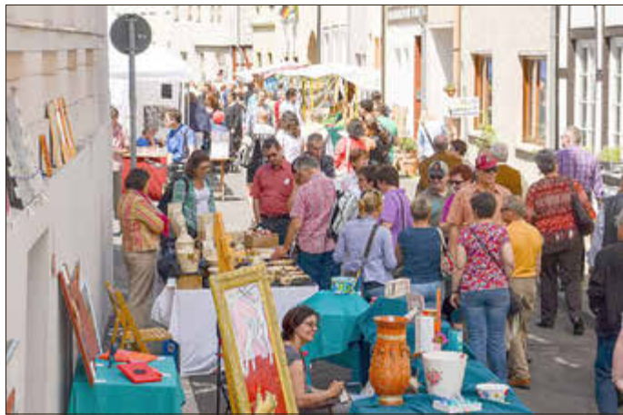
Kunst und Kunsthandwerk beim LebensKunstMarkt in Remagen.

Am 20. und 21. Juni lädt der LebensKunstMarkt in Remagen zu einem besonderen Erlebnis für alle Sinne ein. Mit seiner entspannten, mediterranen Atmosphäre hat sich die Veranstaltung längst als einer der größten und beliebtesten Kunst- und Kunsthandwerkermärkte Deutschlands etabliert.