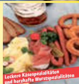
Leckere Käsespezialitäten und herzhaftes Wurstspezialitäten