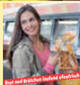
Brot und Brötchen laufend ofenfrisch