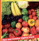
Obst und Gemüse täglich frisch