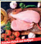
Frisches Fleisch und Geflügel