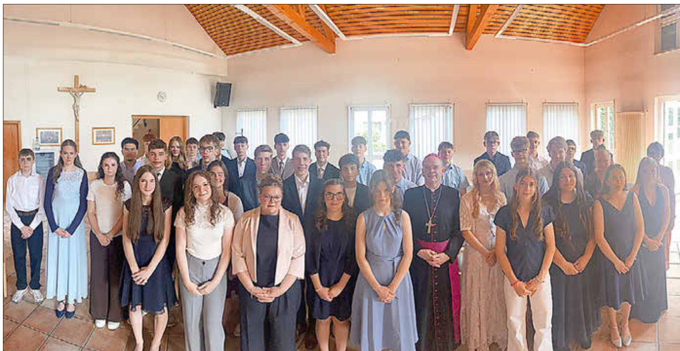
Die Firmlinge 2026 im Breisiger Land