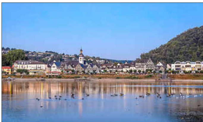
Rheinpromenade Bad Breisig bei Dämmerung

Erleben Sie Bad Breisig einmal anders – geheimnisvoll, stimmungsvoll und voller spannender Geschichten!