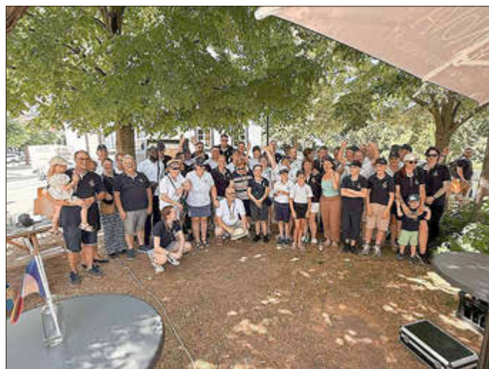
Musik verbindet über Grenzen hinweg seit 60 Jahren die Städtepartnerschaft von Sinzig und Hettange Grande

Die bewegende Zeremonie wurde musikalisch eindrucksvoll gestaltet durch die Harmonie „La Lyre“ aus Hettange-Grande sowie dem Spielmannszug „Freiweg Sinzig“. Gemeinsam mit Pastor Frank Werner und weiteren Mitwirkenden aus beiden Städten entstand eine Atmosphäre, die den Geist der gelebten deutsch-französischen Freundschaft eindrucksvoll widerspiegelte. Ein besonderer Gänsehautmoment war die Darbietung des Liedes „Stammbaum“ der Bläck Fööss – ein musikalisches Symbol für die verbindende Kraft über Grenzen hinweg.